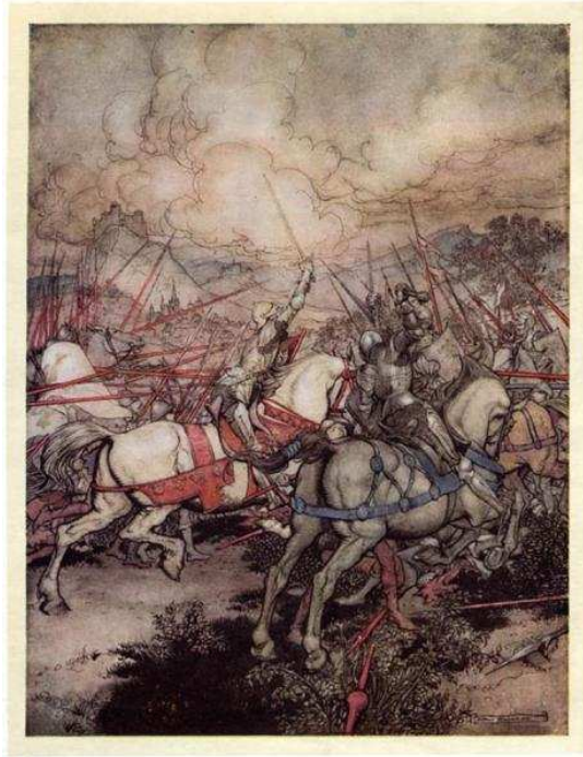
Arthur Rackham, Król Artur po raz pierwszy wyciąga z pochwy swój miecz Excalibur , XX w.