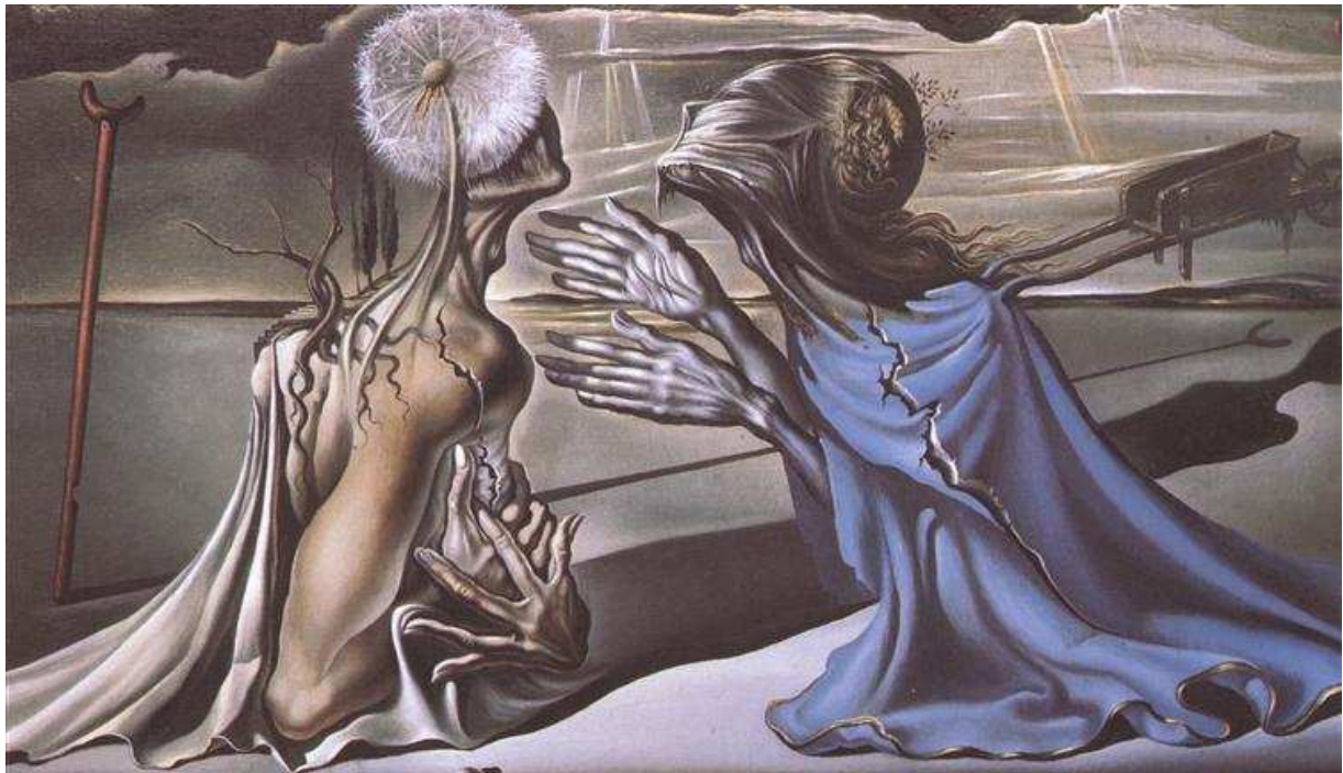
Salvador Dalí, Tristan i Izolda , 1944

Zapoznaj się z obrazem Salvadora Dalego zatytułowanym Tristan i Izolda . Zinterpretuj symboliczną wymowę dzieła. Zwróć uwagę na datę powstania obrazu.