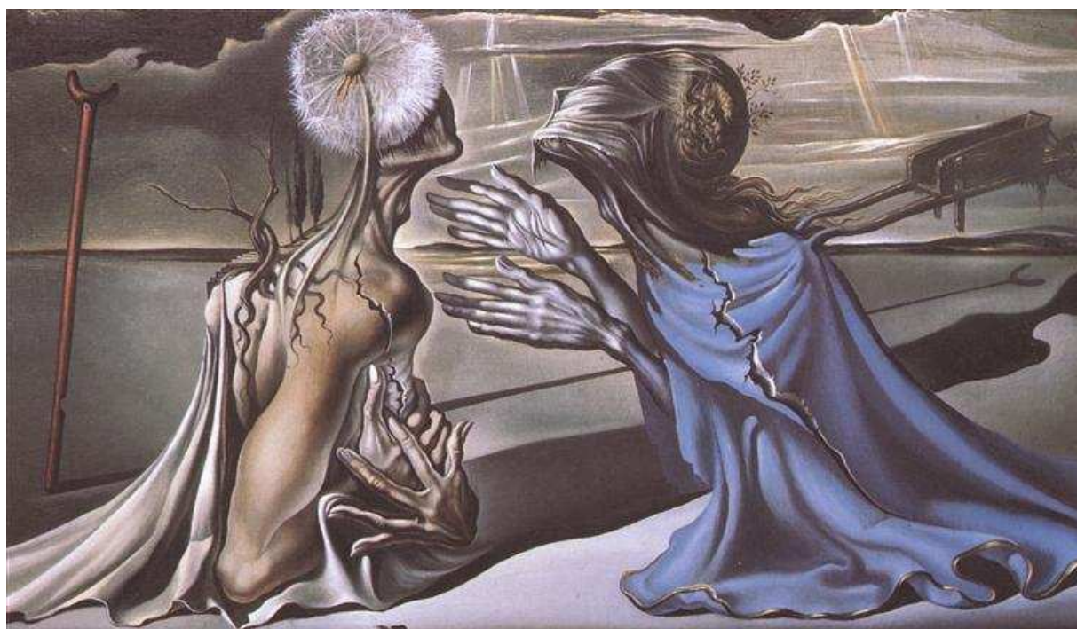
Salvador Dalí, Tristan i Izolda , 1944

Zapoznaj się z obrazem Salvadora Dalego zatytułowanym Tristan i Izolda . Zinterpretuj symboliczną wymowę dzieła. Zwróć uwagę na datę powstania obrazu.