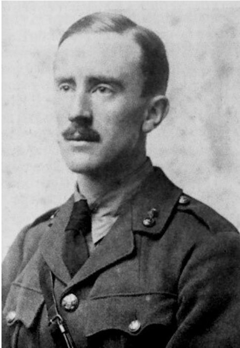
Czarno-białe zdjęcie Johna R.R. Tolkiena

Okazją do spotkania z literacką twórczością Johna Ronalda Reuela Tolkiena (1892–1973) mogła być dla Ciebie lektura Hobbita (opublikowanego po raz pierwszy w 1937 roku) czy Władcy Pierścieni (wydanego w trzech tomach w latach 1954–1955). Po przygotowaniu informacji wskazanych w zadaniu wstępnym wiesz także o Silmarillionie i trudnościach, które towarzyszyły powstawaniu i publikacji (1977) tego nieukończonego dzieła. Trzy wymienione książki stanowią rdzeń zbioru legend traktujących o wykreowanym przez Tolkiena świecie, a zwłaszcza o krainie zwanej w polskim przekładzie