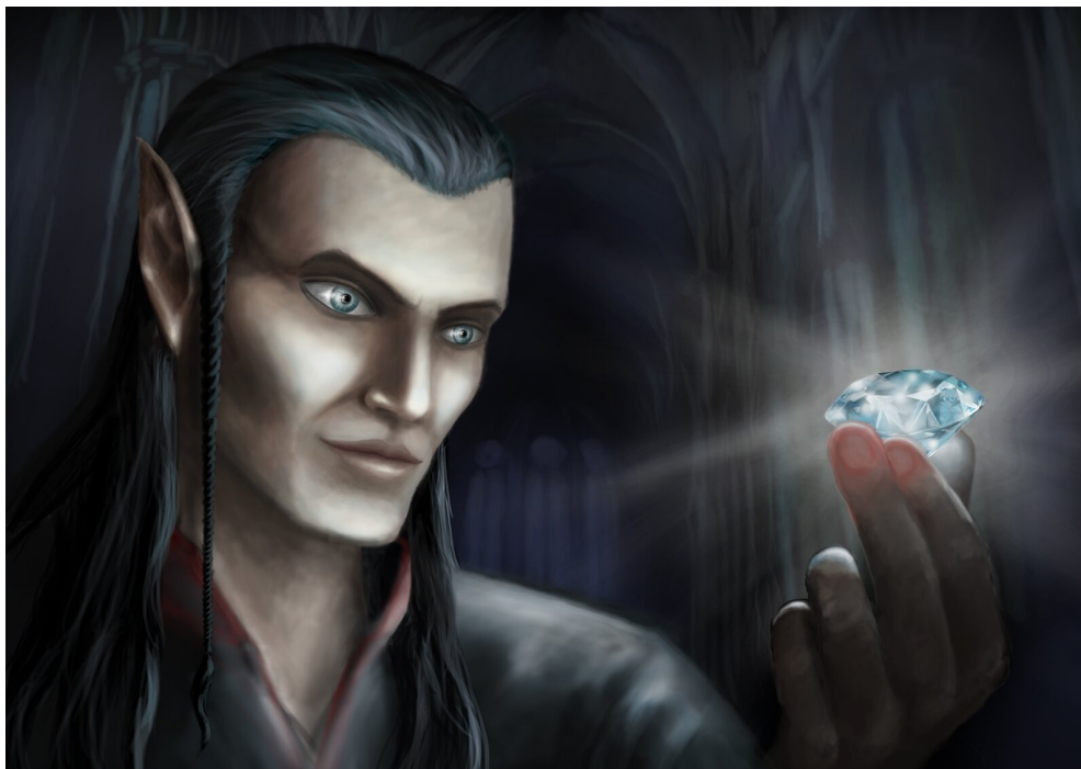
Feanor i jego dzieło