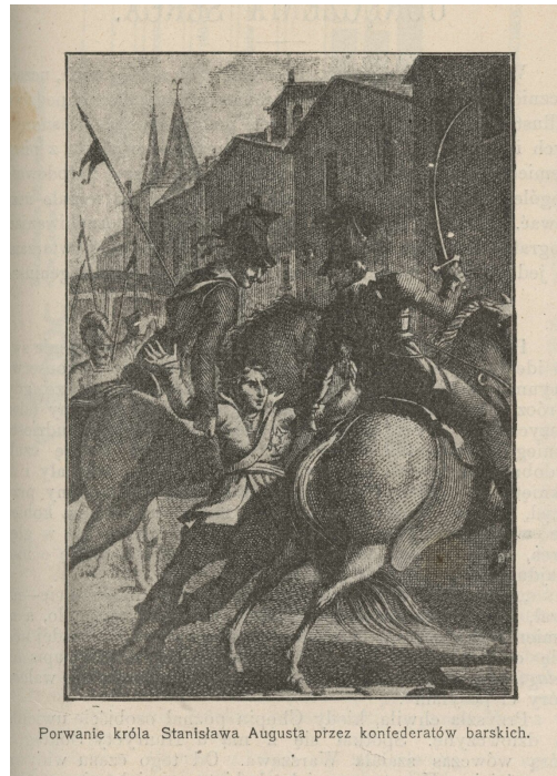
Porwanie króla Stanisława Augusta przez konfederatów barskich.

modernizacji kraju. Szlachta w obronie „wolności i wiary” wystąpiła zbrojnie przeciwko królowi (konfederacja barska w latach 1768 - 1772).