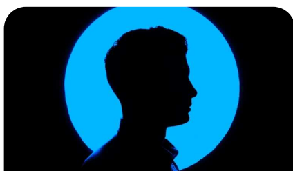
Proces zmiany postaw