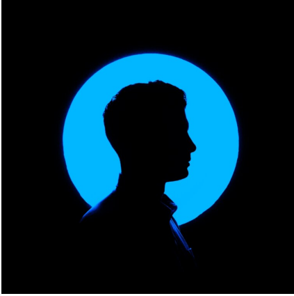
Proces zmiany postaw