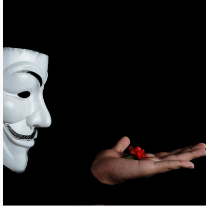
Stereotyp jako przykład postawy