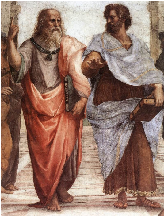
Rafael Santi, Szkoła Ateńska (fragment przedstawiający Platona i Arystotelesa), 1509–1511

Arystoteles spędził 20 lat w Akademii Platonskiej jako najwybitniejszy uczeń Platona. Swą własną szkołę, założoną w pobliżu świątyni Apollina Likejosa (stąd nazwa Likejon - Liceum), prowadził przez lat 12. Przez ten czas napisał niemal wszystkie swe dzieła, które tak silnie wpłynęły na potomnych.