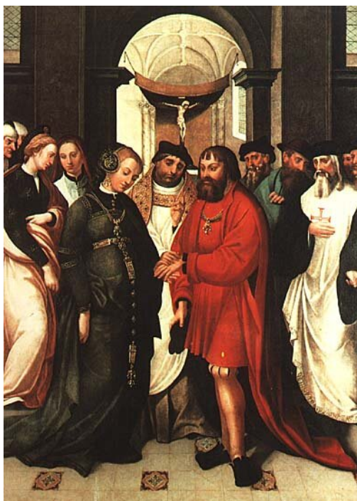
Ślub św. Aleksego, 1541

Źródło: Legenda o świętym Aleksym , dostępny w internecie: https://wolnelektury.pl/katalog/lektura/legenda-o-sw-aleksym.html .