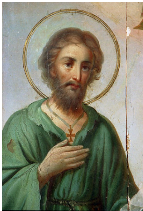
Prawosławna Ikona Aleksego z Rzymu, Rosja, XIX w.