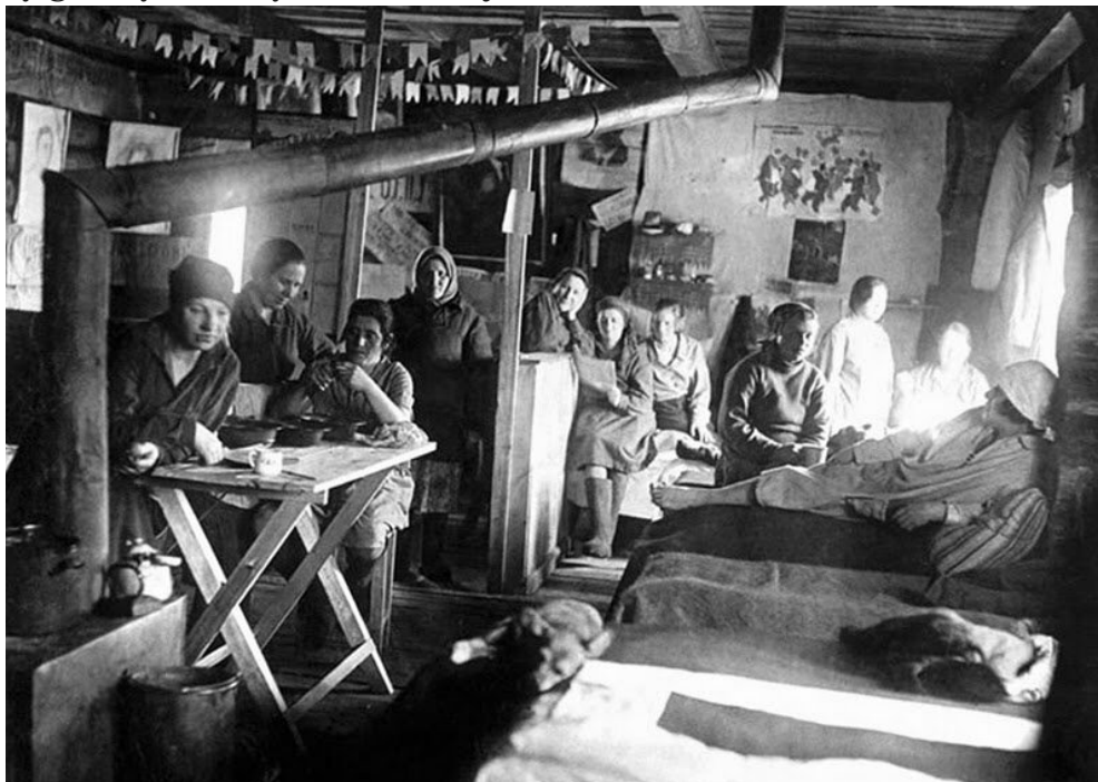
Gułag, 1930 r.

Łagrowa machina zawsze opierała się na jednym niezmiennym założeniu – należy dążyć do poniżenia jednostki ludzkiej, bezlitosnego jej wykorzystania. Sowieccy decydenci nie byli zainteresowani pseudonaukowymi teoriami, propagowanymi przykładowo przez hitlerowców, chcących usankcjonować swoje zbrodnicze działania w obozach koncentracyjnych. Do łagru trafić mógł każdy – obok pospolitych przestępców przebywali tam intelektualiści, politycy, duchowni, kobiety i dzieci. Represje i eksterminacja podyktowane były zasadami walki klasowej – likwidacji fizycznej wrogów rewolucji, całych klas społecznych czy „wrogich” narodów. Realnie więźniowie nie mieli żadnych praw – byli wyniszczani przez ciężką pracę, głód, fatalne warunki, nieleczone choroby. Na porządku dziennym były gwałty dokonywane na więźniarkach. Dochodziło do wielu samobójstw.