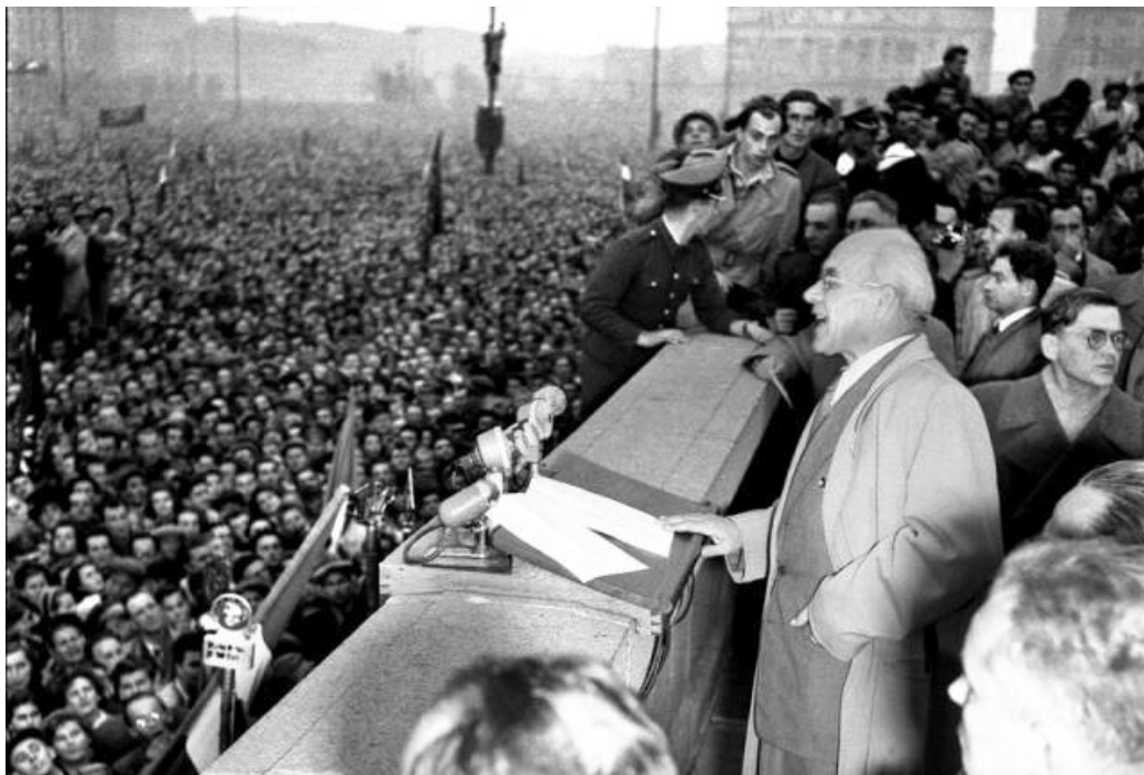
Gomułka w trakcie przemówienia 24 października 1956 r.

Źródło: Michał Głowiński, Nowomowa (Rekonesans) , [w:] Michał Głowiński, Nowomowa i ciągi dalsze. Szkice dawne i nowe , Kraków 2009, s. 30.