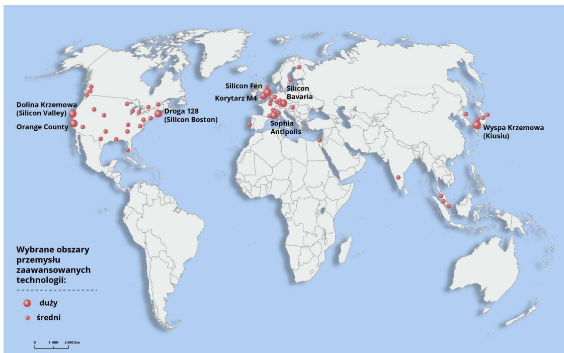
Wybrane obszary przemysłu zaawansowanych technologii na świecie

Przemysł zaawansowanych technologii jest kapitałochłonny: wymaga kosztownych badań naukowych i marketingowych. Jednocześnie zużywa małe ilości surowców, oferuje wysoką jakość nowoczesnych produktów i przynosi szybsze zyski niż tradycyjny przemysł. Zakłady podlegają ciągłemu unowocześnianiu w celu sprostanania konkurencji i potrzebom rynku, zatrudniając w tym celu wysoko wykwalifikowaną kadrę specjalistów. Pomiedzy wieloma zakładami ma miejsce szeroka kooperacja. Małej lub średniej wielkości przedsiębiorstwa zatrudniają z reguły kilkadziesiąt osób i pracują najczęściej dla uznanego na rynku producenta. Mogą też być własnością międzynarodowych koncernów (np. Microsoft, Samsung, Siemens, Toshiba). Ponadto można wyróżnić takie cechy, jak technicznie trudne i skomplikowane procesy produkcji, stałe unowocześnianie produkcji, krótki cykl żywotności produktu oraz znaczny udział kadry naukowej i inżynieryjno-technicznej w zatrudnieniu.