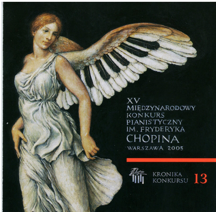
Strona tytułowa kroniki XV Międzynarodowego konkursu Chopinowskiego

przesłuchań z czterech do trzech etapów, a także uproszczenie systemu oceny uczestników. W Konkursie wzięło udział 80 pianistów z 18 krajów.