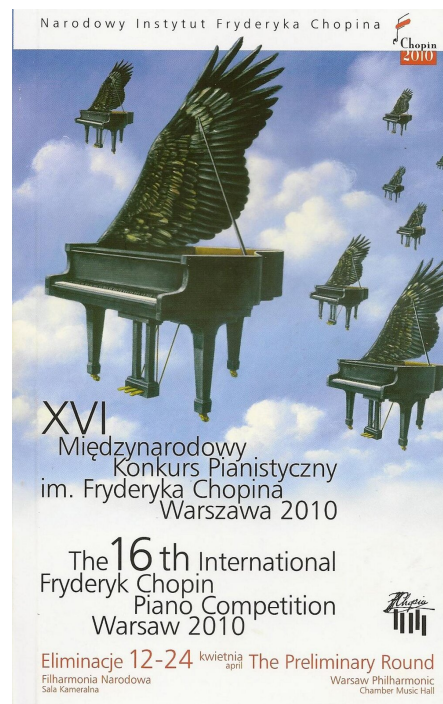
Plakat XVI Konkursu Chopinowskiego

XVI Konkurs Chopinowski trwał od 30 września do 23 października 2010 r. Był to Konkurs przypadający w roku ważnego jubileuszu – 200. rocznicy urodzin polskiego kompozytora. Po raz pierwszy organizatorem był Narodowy Instytut Fryderyka Chopina. Nowością w programie konkursu była Sonata c-moll op. 4 Chopina, a wśród instrumentów do wyboru uczestników pojawiła się nowa marka – Fazioli. Podobnie jak podczas poprzedniej edycji, słuchacze mogli śledzić konkursowe zmagania przez radio, telewizję i Internet. W XVI Konkursie uczestniczyło 78 pianistów z 21 państw.