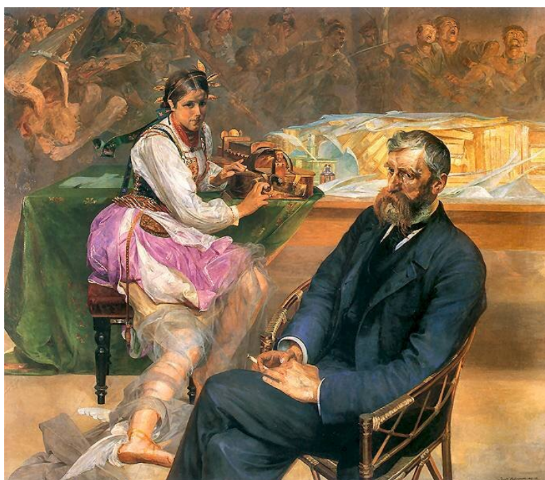
Portret Adama Asnyka z Muzą