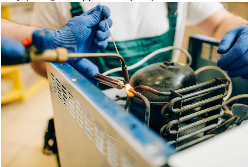
Rys. 3. W skraplaczu gaz ulega skropleniu, oddając ciepło do otoczenia

Najważniejszą częścią instalacji jest sprężarka, zasilana energią elektryczną. To urządzenie, które pompuje czynnik chłodniczy przez cały układ lodówki. Podczas przechodzenia czynnika chłodniczego przez sprężarkę ma on postać gazu. Sprężanie gazu zwiększa jego ciśnienie, a tym samym temperaturę. W takiej formie czynnik chłodniczy trafia do skraplacza, czyli do krętych rur z tyłu lodówki (Rys. 3.). Tu gaz skrapla się, oddając ciepło do otoczenia. Aby powstała ciecz schłodzić jeszcze bardziej przepuszcza się ją przez bardzo cienką rurkę zwaną kapilarą. To powoduje zmniejszenie ciśnienia i temperatury. Teraz zimna ciecz trafia do parownika, gdzie w warunkach niskiej temperatury i ciśnienia, zaczyna wrzeć. Wrzenie związane jest z pobieraniem ciepła z otoczenia, dlatego parownik umieszczony jest w komorze chłodniczej lodówki. Czynnik chłodniczy w postaci gazu jest kierowany do sprężarki, gdzie cały proces zaczyna się od nowa.