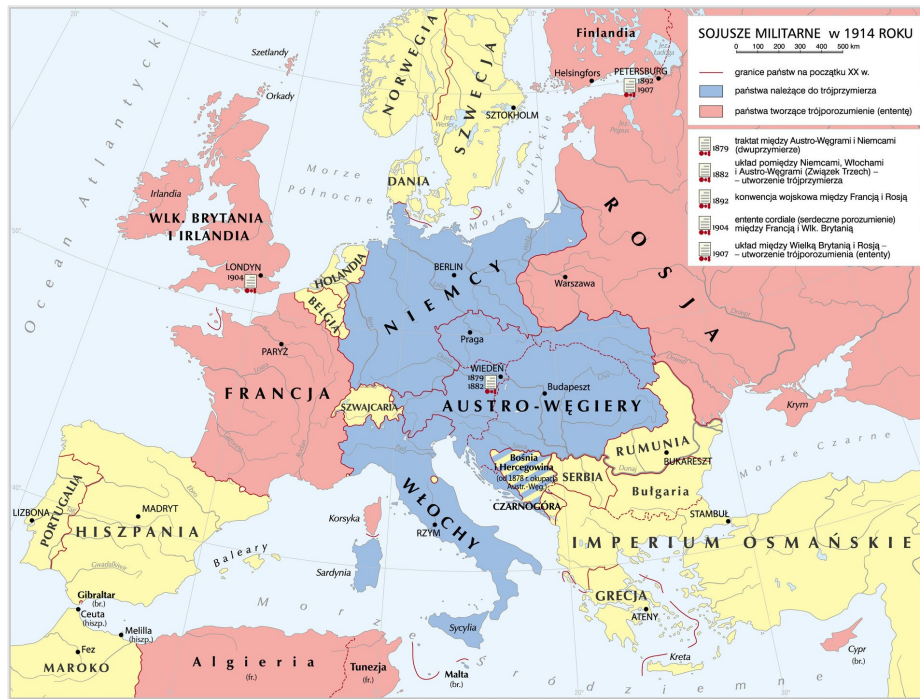
Military alliances in 1914

On the map, point to the countries that belonged to Triple Entente and those that belonged to Triple Alliance . Characterize the consequences of their position on the map of Europe in relation to the alliances.