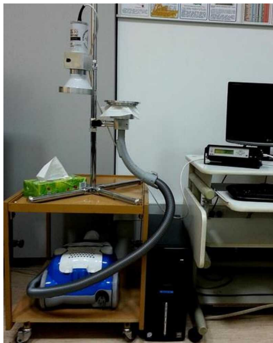
Rys. a. Układ do pomiaru stężenia gazu promieniotwórczego - radonu - w powietrzu (zdjęcie zestawu wykorzystywanego w Laboratorium Podstaw Fizyki na Wydziale Fizyki Politechniki Warszawskiej).