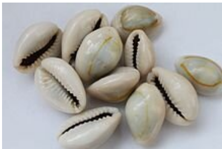
Cowry shells used as money.