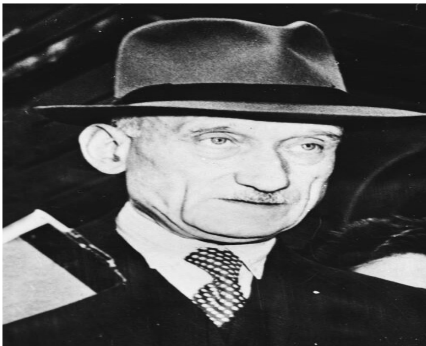
Robert Schuman , 1949, fotografia