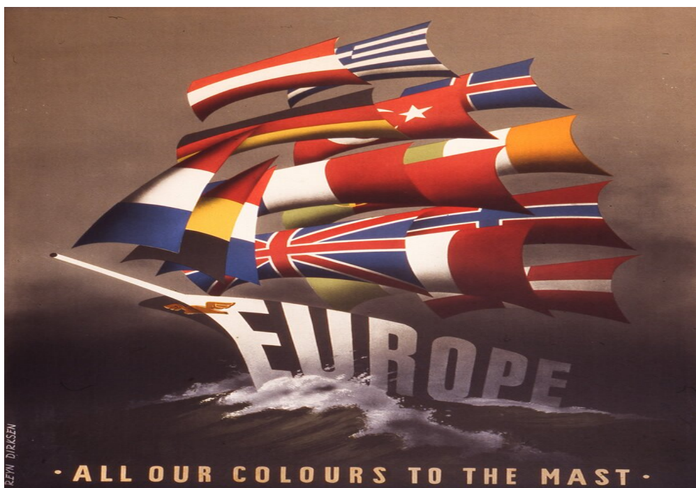
Plakat promujący Plan Marshalla , 1950, Economic Cooperation Administration