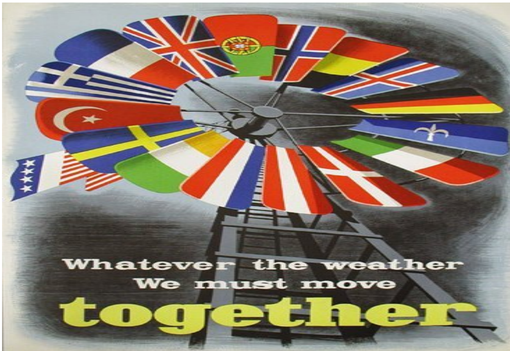
Plakat promujący Plan Marshalla , 1950, Economic Cooperation Administration . Napis: Bez względu na pogodę musimy ruszać razem.