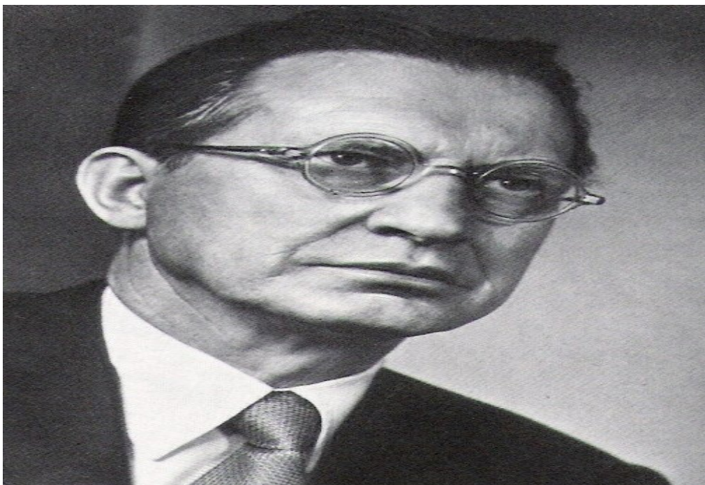
Alcide de Gasperi, 1953, fotografia,