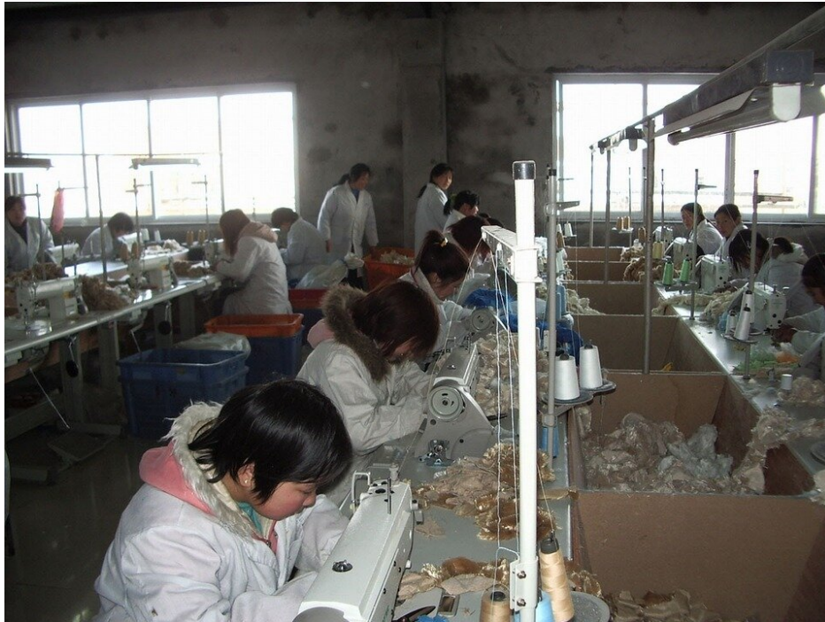
Szwaczki w chińskiej fabryce

i korporacjom transnarodowym ani jednostkowym konsumentom w prowadzeniu wymiany handlowej z Chinami. Potępiamy ten rząd za naruszenia praw człowieka, a zarazem korzystamy z tanich, chińskich produktów. Podobna sytuacja i przyczyny naruszeń praw człowieka występują w innych państwach Dalekiego Wschodu.