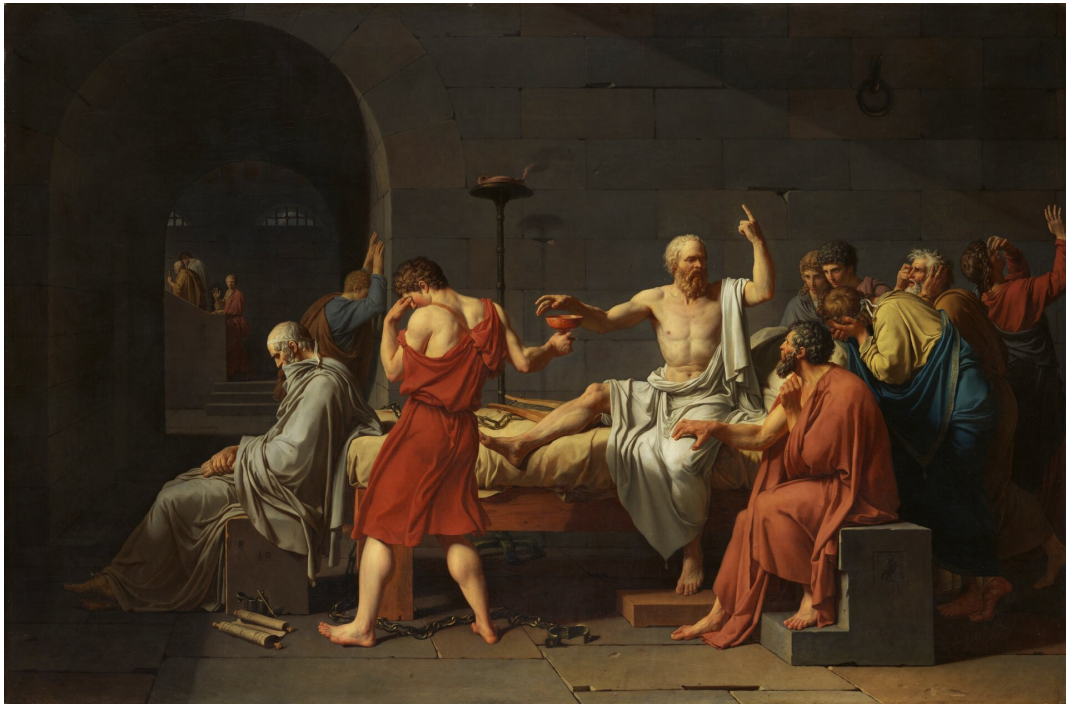
Jacques-Louis David, Śmierć Sokratesa, 1787