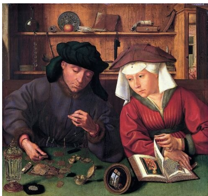
Quentin Massys, Bankier z żoną , 1514 r.

W epoce pieniądza kruszcowego o wartości monety decydowała ilość zawartego w niej srebra lub złota. Oszuści potrafili obrzynać brzegi monet, by w ten sposób uszczknąć nieco kruszcu i powiększyć swój zysk.