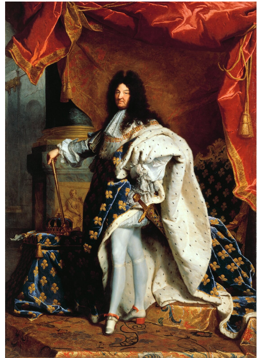
Portret Ludwika XIV, 1702.

Charakterystyczne dla oświecenia problemy i stanowiska można już wprawdzie zaobserwować w literaturze francuskiej przełomu XVII i XVIII w., jednak to właśnie śmierć Ludwika XIV stanowi punkt przełomowy, w którym proces popularyzacji idei oświeceniowych nabral gwałtownego przyspieszenia, doprowadzając do rozpadu monarchii absolutnej oraz związanych z nią instytucji społecznych, obyczajów i norm.