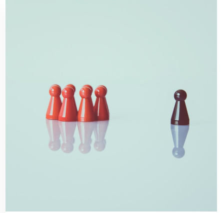
Współczesne problemy: rasizm, antysemityzm, szowinizm, ksenofobia