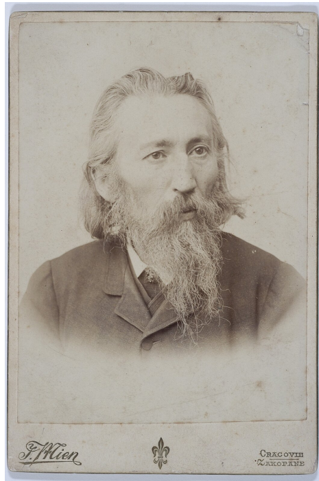
Jak Matejko - portret