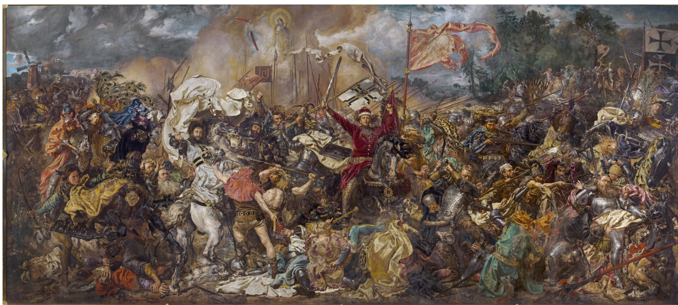
Jan Matejko, Bitwa pod Grunwaldem