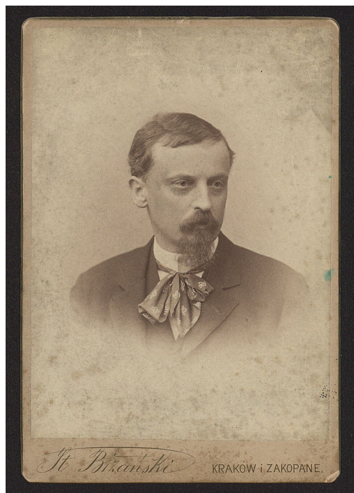
Henryk Sienkiewicz - portret