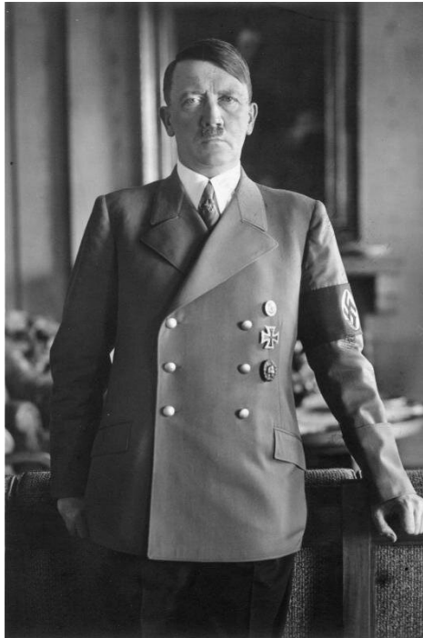
lic. CC BY-SA 3.0, Bundesarchiv, Bild, Wikimedia Commons

Adolf Hitler (1889-1945) – główny przywódca niemieckich nazistów, od 1933 roku kanclerz Rzeszy.