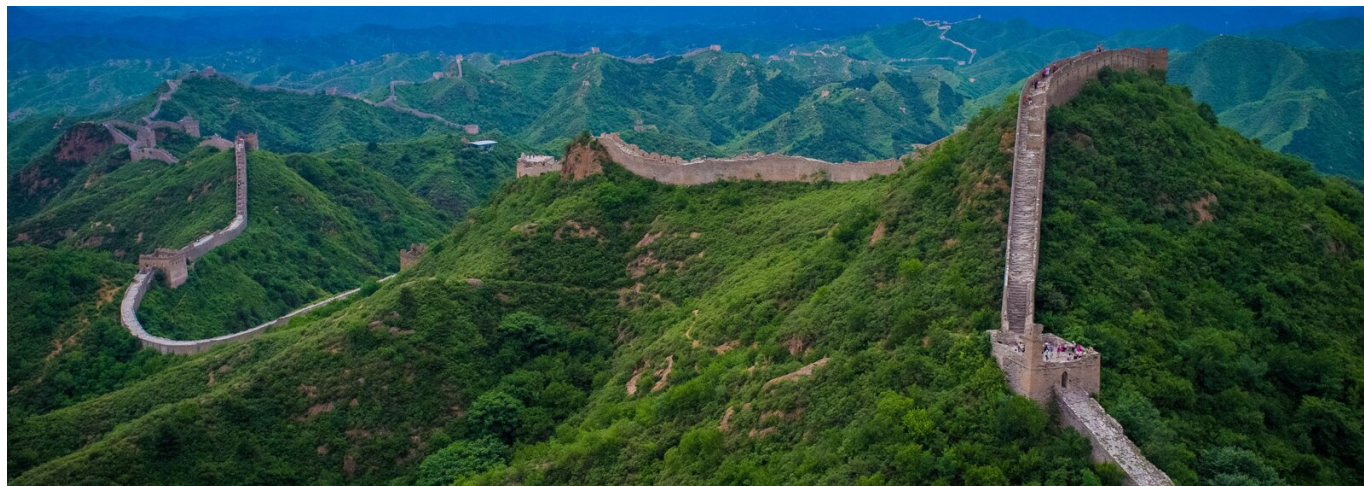
Wielki Mur Chiński