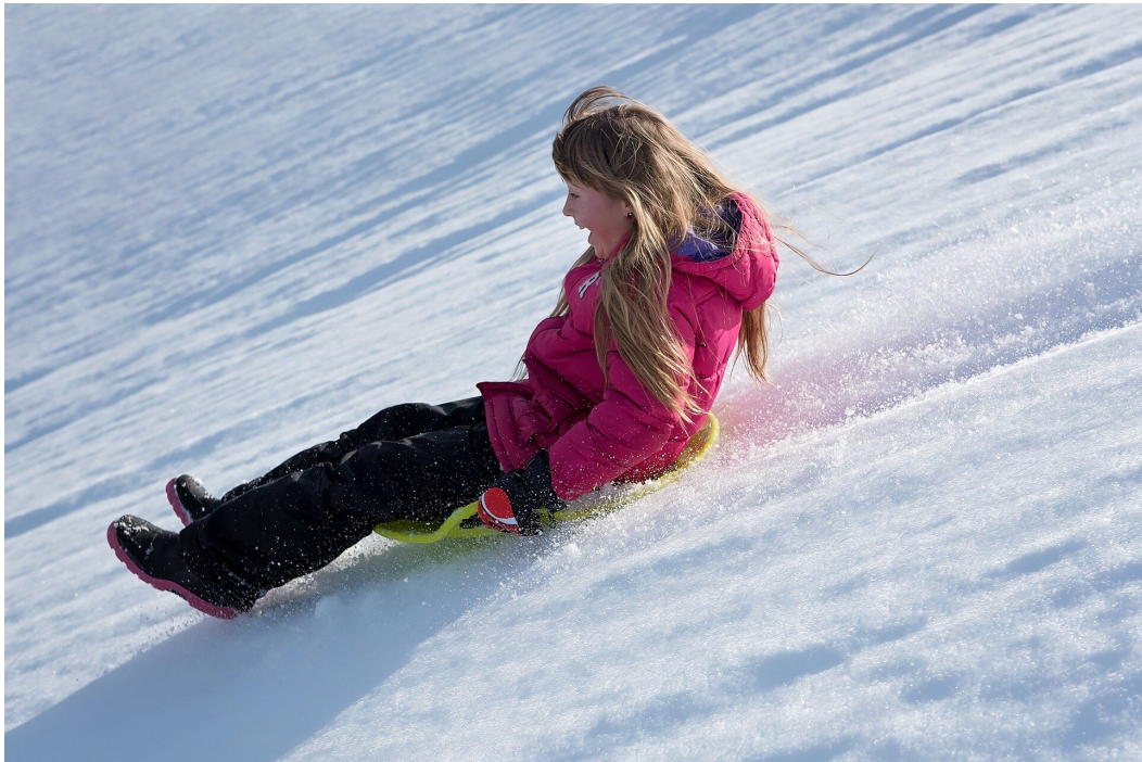
Fot. a. Z góry na pazurki ! Mniejszy opór - większa frajda.