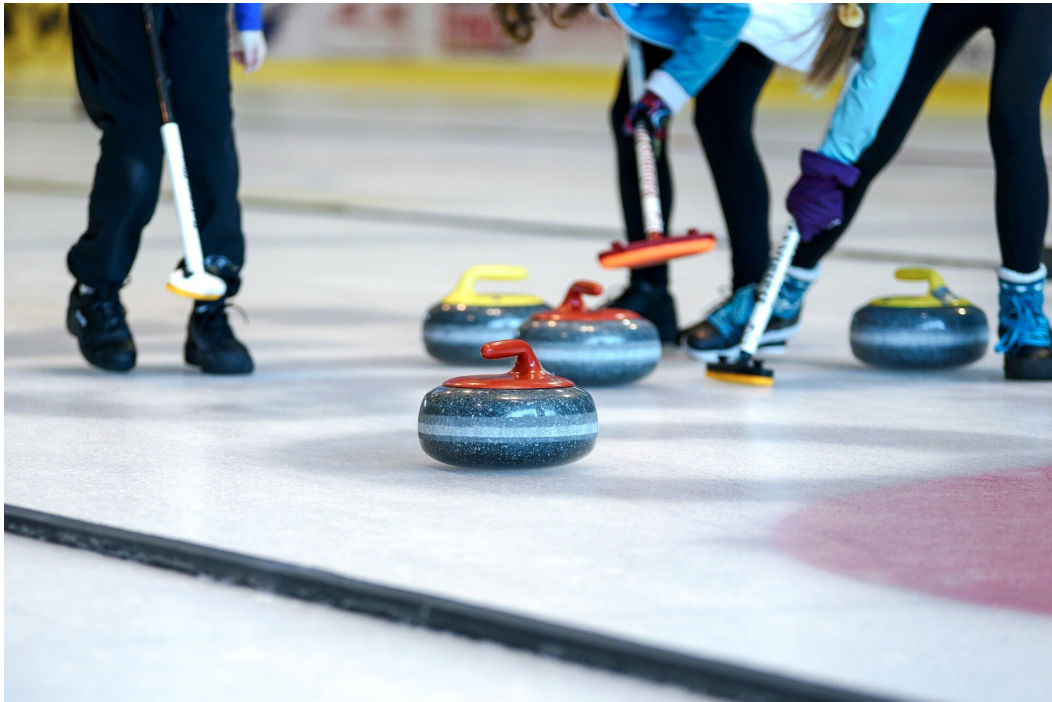
Rys. 1. Szczotek w curlingu używa się do szczotkowania lodu. Agresywne szczotkowanie sprawia, iż lód zwiększa swoją temperaturę, przez co zmienia się tarcie i prędkość kamienia.