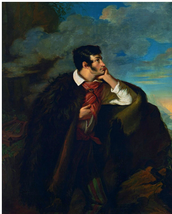
Walenty Wańkiewicz, Portret Adama Mickiewicza na Judahu skale , 1827-1828

Etyka Platona za wartościowe uznawała dobra idealne, zaś na ich szczycie znajdowała się idea Dobra. Według Platona cnota polegała na dążeniu do niej. Nie chodziło o to, aby dobra realne potępiać, lecz by zobaczyć w nich drogę do dóbr wyższego rzędu. Popędy ciągną