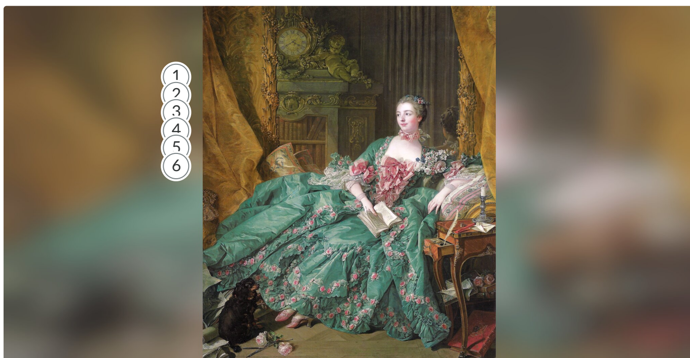
François Boucher, Madame de Pompadour , 1756

Madame de Pompadour została ukazana na obrazie François Bouchera. Przyjrzyj się dziełu i wypisz cechy (zewnątrzne i wewnętrzne) namalowanej kobiety.