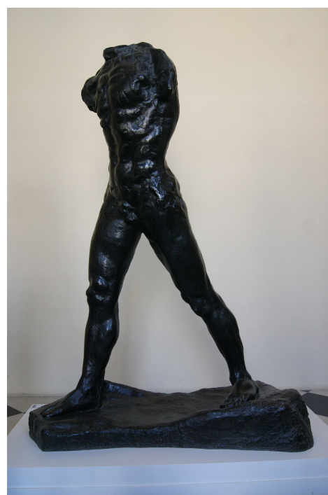
August Rodin, Człowiek, który idzie , 1907, Paryż Rzeźba w zaskakujący sposób ukazuje człowieka