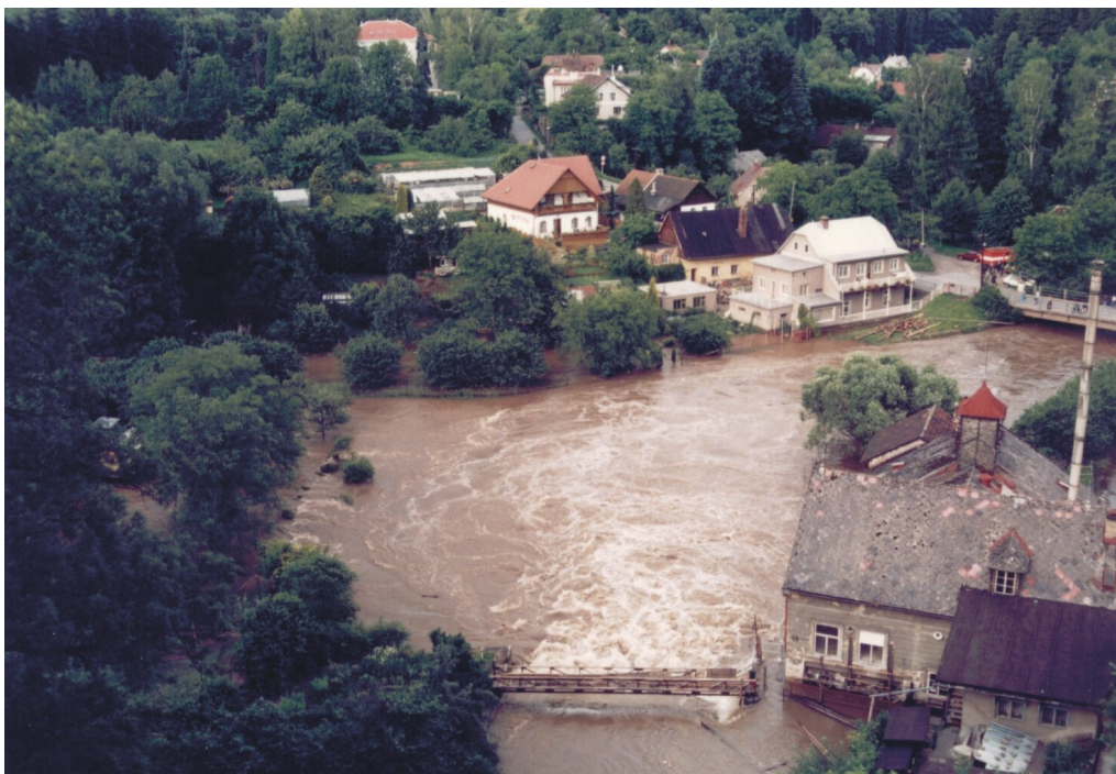
Powódź w Nowym Mieście nad Metują