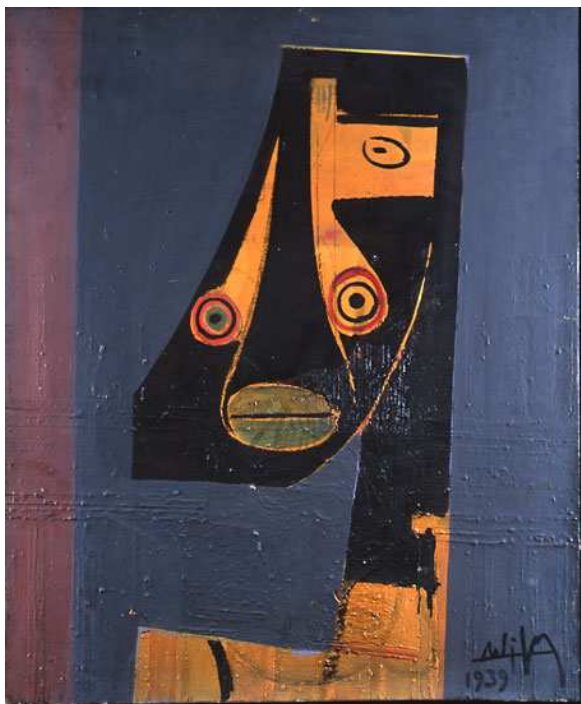
Wifredo Lam, Visage cubiste , 1939