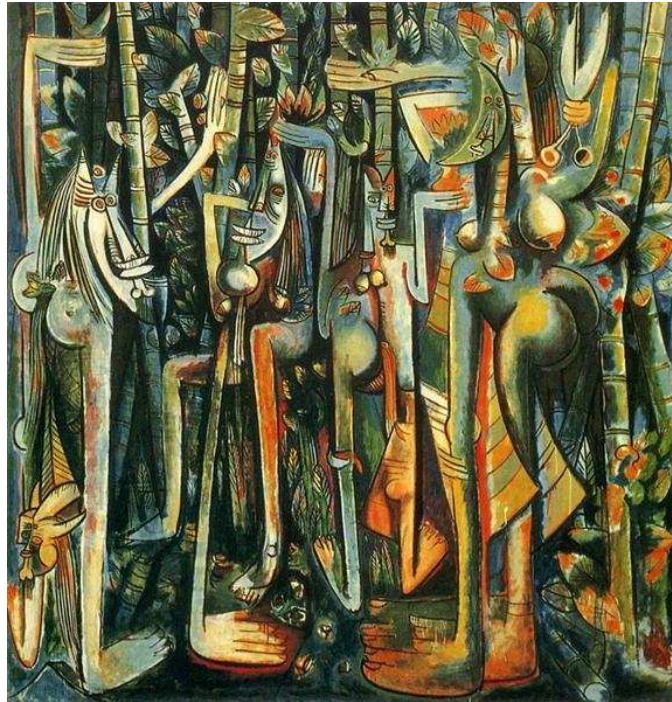
Wifredo Lam, Dżungla , 1943

nie jest w stanie funkcjonować poza formą, gdyż bez niej nie potrafi budować relacji z innymi ludźmi.