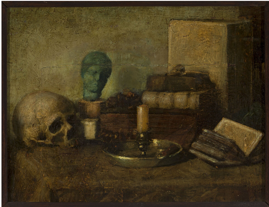
Vanitas – martwa natura z trupa czaszką, autor nieznany, XIX w.