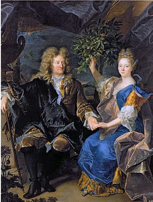
Hyacinthe Rigaud, Hrabia Jan Andrzej Morsztyn z córką , XVIII w.