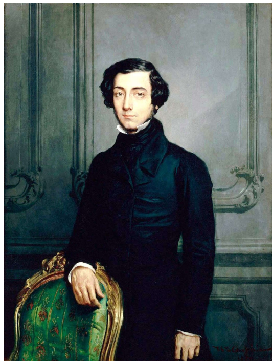
Alexis de Tocqueville

Demokracja, już na początku zaistnienia w swej nowożytnej formie w Stanach Zjednoczonych Ameryki, doczekała się uważnego i przenikliwego obserwatora w osobie Alexisa de Tocqueville’a (1805–1859 r.) – francuskiego myśliciela i polityka, jednego z klasyków liberalizmu. W 1831 r. jako urzędnik francuskiej administracji Tocqueville został wysłany do Stanów Zjednoczonych w celu zapoznania się z tamtejszym systemem penitencjarnym. Roczny pobyt w Stanach zaowocował słynnym dziełem O demokracji w Ameryce (pierwszy tom