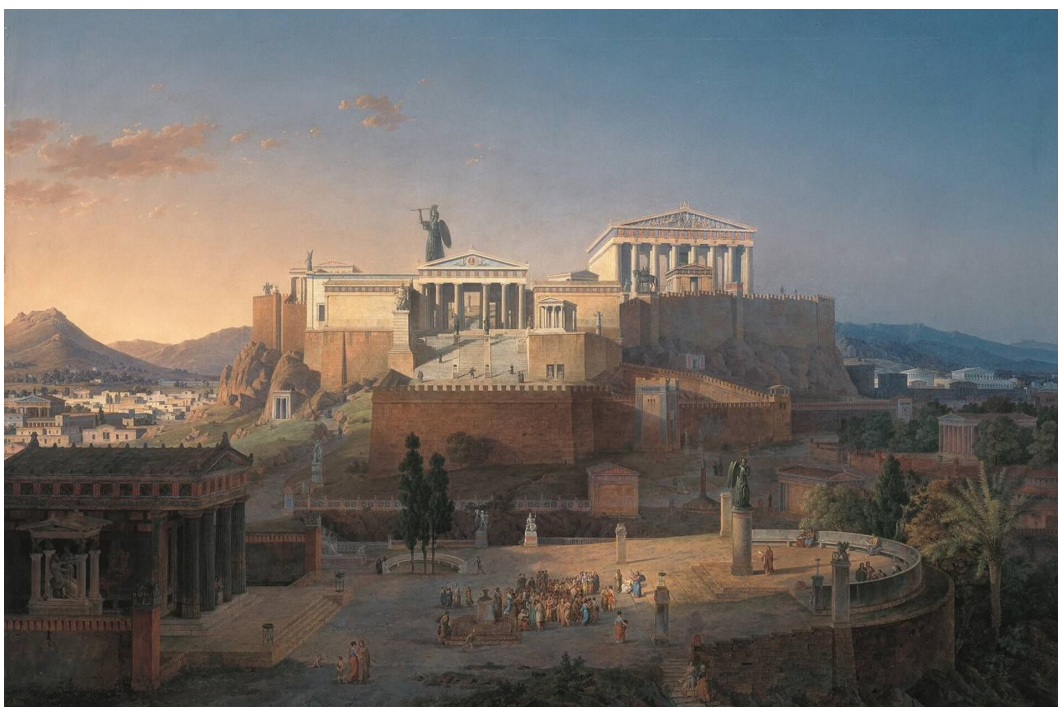
Leo von Klenze, Rekonstrukcja Akropolu i Areopagu w Atenach , 1846 r.

Z przytoczonej na początku sentencji możemy wywnioskować, że Tocqueville nie darzył demokracji sympatią. Pochodził z rodziny arystokratycznej ciężko doświadczonej przez Rewolucję Francuską i z dużym sentymentem wspominał dawne czasy. Analiza historii ludzkości doprowadziła go jednak do wniosku, że dzieje to stopniowy postęp na drodze ku demokracji i że demokracja wraz ze wszystkimi jej wadami, jest nieuchronna. W odróżnieniu jednak od pesymistów i katastrofistów starał się znaleźć sposoby złagodzenia, przewyciężenia negatywnych stron demokracji.