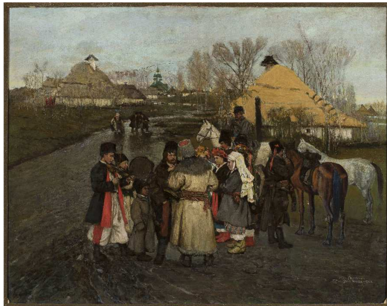
Stanisław Masłowski, Rozmowa na wiejskiej drodze , 1921

Źródło: Władysław Stanisław Reymont, Chłopi , t. 1, Warszawa 2001, s. 29.