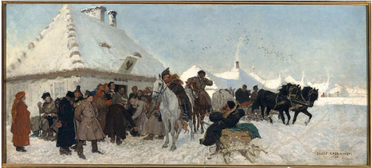
Józef Chełmoński, Sprawa u wójta , 1873