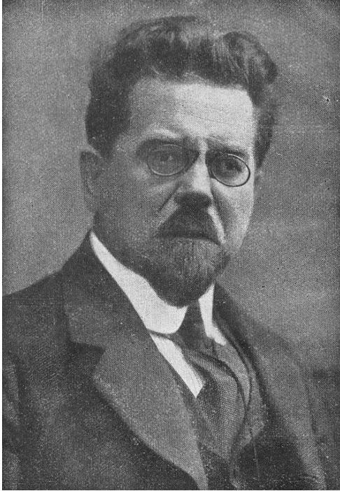
Władysław Stanisław Reymont

Powieść Chłopi wpisuje się w nurt młodopolskiej fascynacji wsią. Reymont opisuje świat bardzo odległy od znanej z wcześniejszej literatury polskiej kultury ziemiańskiej. Nie jest to już jednak idealistyczne widzenie natury i jej mieszkańców, a podejście obserwatora realisty, opisującego wieś z rzetelnością etnografa . Autor z dużą wnikliwością oddaje gwarę wiejską, zwraca uwagę na detale strojów, obserwuje relacje międzyludzkie, opisuje ludowe zwyczaje i obchody świąt religijnych.