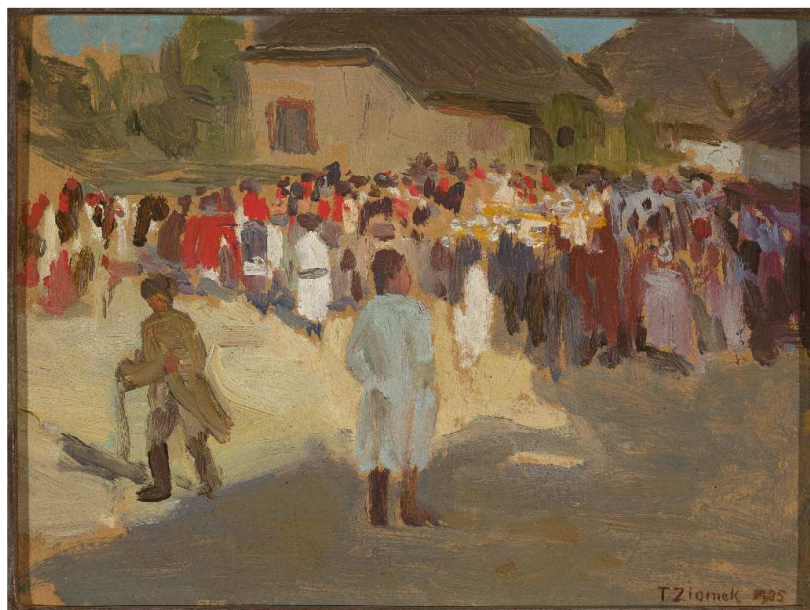
Teodor Ziomek, W wiosce w niedzielę , 1905

Źródło: Władysław Stanisław Reymont, Chłopi , t. 1, Warszawa 2001, s. 159–160.