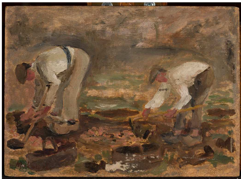
Tadeusz Makowski, Praca w polu , 1917

W opisywanych przez Reymonta rodzinach chłopów panuje wyraźny podział ról i obowiązków. Jednak czasami zdarza się, że dorosłe dzieci naruszają taki stan rzeczy i buntują się przeciw władzy ojca, ponieważ czują się wyzyskiwane i ciągle zależne od woli rodziców. Obie strony wkładają w gospodarstwo cały swój wysiłek i oczekują należnych profitów. Dlatego kiedy w chałupie Macieja Boryny pojawia się młoda żona – osoba z zewnątrz, która nieoczekiwanie będzie miała dodatkowe przywileje i korzystała z wypracowanych wcześniej przez całą rodzinę dóbr, sytuacja staje się napięta i rozpoczynają się spory.