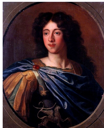
Franciszek Ludwik Conti.

Po śmierci Jana III w 1696 r. wyszły na jaw wszystkie negatywne konsekwencje wolnej elekcji . Rywalizujący ze sobą kandydaci do tronu Rzeczypospolitej prześcigali się w staraniach nie tylko o przychyłność szlachty, lecz także obcych dworów. Przed śmiercią król upatrywał swego następcy w najstarszym synu, Jakubie Sobieskim, ale szanse na objęcie przezeń tronu pogrzebał jego spór z matką o spadek oraz brak pieniędzy na przekupienie wyborców. Elekcja w 1697 r. była rozdwojona, a konkurencyjne koła wskazały swoich faworytów: jedno księcia Franciszka Ludwika Contiego z bocznej linii Burbonów, którego popierał Ludwik XIV, drugie zaś elektora saskiego Augusta Wettina, zwanego Mocnym, hojną ręką kupującego głosy magnaterii oraz jej klienteli. Ten ostatni wcześniej przybył do Polski i objął władzę, kiedy więc zwlekający dotąd Conti pojawił się w asyście floty francuskiej na gdańskiej redzie, nawet nie zszedł na ląd. Było to ostatnie bezkrólewie bez udziału obcych wojsk.