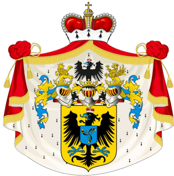
Herb rodziny Radziwiłłów.