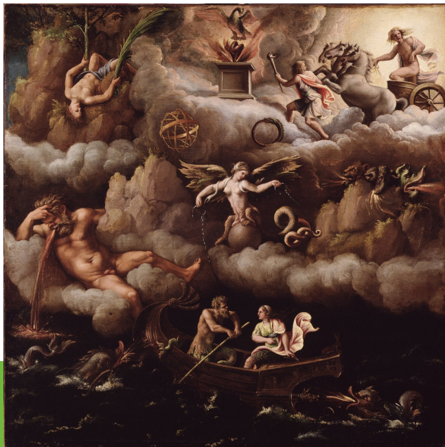
Giulio Romano, Alegoria nieśmiertelności , ok. 1540

zmysłową, a człowiek – rozumną. Za Arystotelesem przyznał, że rozumna dusza jest istotą człowieka, ale zarazem cielesność człowieka przesądza o realnym istnieniu ludzi. Człowiek zatem, według Akwinanty, to duchowo-cielesna jedność. Przyjmował on zarazem pozaempiryczne, supranaturalistyczne pochodzenie duszy.