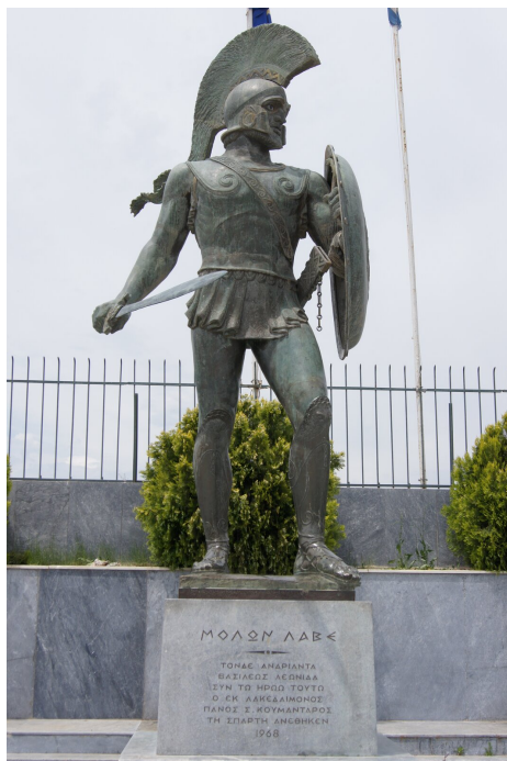
Statua Leonidasa I w Sparcie

Praxinoa, Statua Leonidasa I w Sparcie, licencja: CC BY-SA 3.0