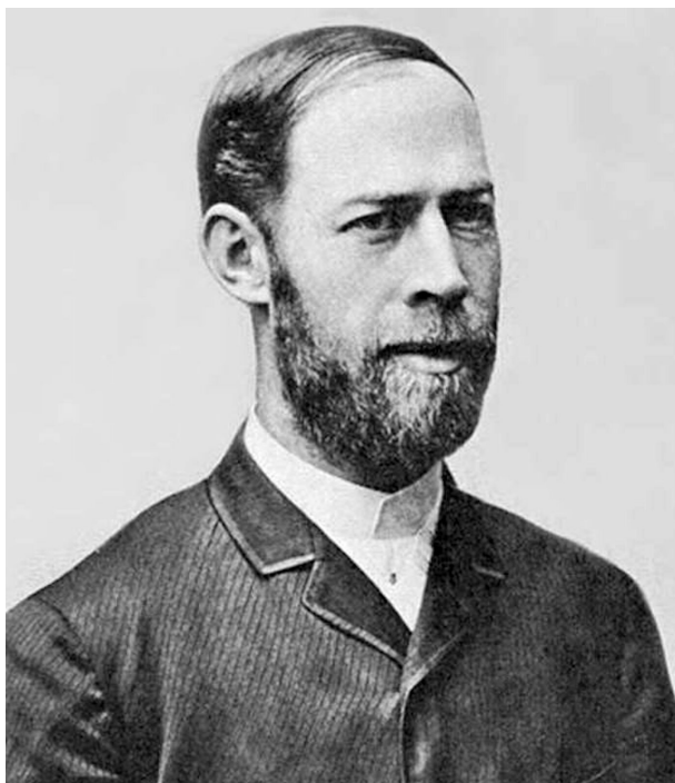
Rys. a. Heinrich Hertz.