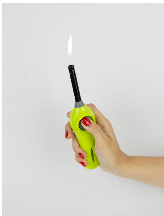
Rys. b. Zapalnik iskrowy gazu.

Wykonał eksperyment, który dalej w e-materiale opiszemy, ale w tym miejscu powiemy tylko, że eksperyment jest na tyle prosty, że możemy go powtórzyć w swojej kuchni. Bowiem podczas zapalania gazu często używamy piezoelektrycznego iskrownika, takiego jak przedstawiony na Rys. b., albo wbudowanego w kuchenkę. Jeśli wytworzymy w nim iskrę, to w pobliskim włączonym radioodbiorniku usłyszymy zakłócenie w postaci trzasku. To znak, że właśnie odebraliśmy falę elektromagnetyczną wytworzoną w momencie pojawienia się iskry elektrycznej.