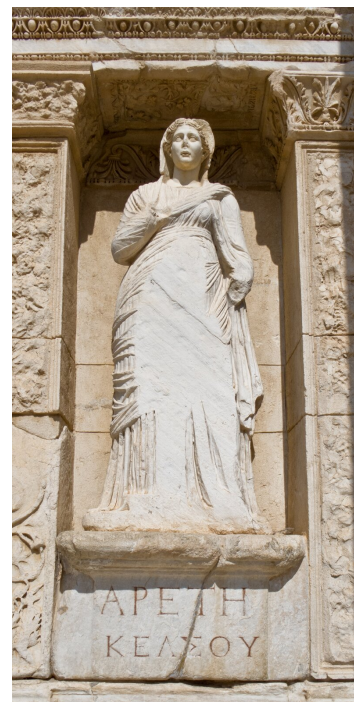
Personifikacja cnoty (gr. ἀρετή) w Bibliotece Celsusa w Efezie

W relacjach walidacyjnych chodzi o to, w jaki sposób niezgodność prawa z normami moralnymi wpływa na obowiązywanie norm prawnych.