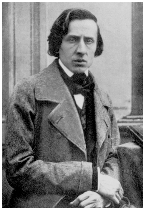
Chopin w 1849, fot. Louis-Auguste Bisson.

sztuki w romantycznym stylu. Jedną z powtarzających się ozdób tych wnętrz były kwiaty, szczególnie fiołki.