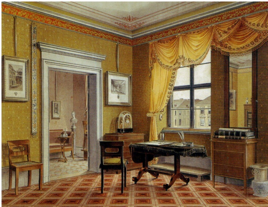
Leopold Zielcke, Pokój w stylu Biedermeier. Wynalazek prostoty , akwarela, 1825 r. Charakterystyczna dla stylu Biedermeier jest prostota, objawiająca się np. w formie mebli. Wymień cechy tej estetyki widoczne na obrazie. Źródło: Wikimedia Commons, domena publiczna.

Charakterystyczny dla tego okresu był dandyzm – jego cechy to wyszukana, często przesadna elegancja, nienaganne maniery i dbałość o strój. Postawa ta przejawiała się w kontrze do mieszczańskiej rzeczywistości.