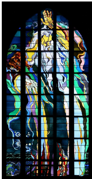
Stanisław Wyspiański, witraż „Bóg Ojciec”, 1904, kościół franciszkanów w Krakowie

In principiō creāvit Deus cælum et terram. Terra autem erat inānis et vacuā, et tenebræ erant super faciem abyssi , et spīritus Deī ferēbātur super aquās. Dīxitque Deus: “ Fiat lūx ”. Et facta est lūx. Et vidit Deus lucem quod esset bona: et divisit lucem ac tenebrās. Appellāvitque Deus lūcem Diem et tenebrās Noctem. Factumque est vesperē et māne , diēs ūnus. Dīxit quoque Deus: “Fīat firmāmentum in mediō aquārum et dīvidat aquās ab aquīs”. Et fēcit Deus firmāmentum, dīvisitque aquās, quæ erant sub firmāmentō, ab hīs, quæ erant super firmāmentum. Et factum est ita. Vocāvitque Deus firmāmentum, Cælum. Dīxit autem Deus: “Fiant lūmināria in firmāmentō cæli, ut dīvidant diem ac noctem”. Et factum est ita. Dīxit quoque Deus: “ Prōdūcat terra animam vīventem in genere suō: iūmenta , et reptilia , et bēstiās terræ secundum speciēs suās”. Factumque est ita. Et ait Deus: „Faciāmus hominem ad imāginem et similitūdinem nostram”. Et creāvit Deus hominem ad imāginem suam, ad imāginem Deī creāvit illum; masculum et fēminam creāvit eōs.