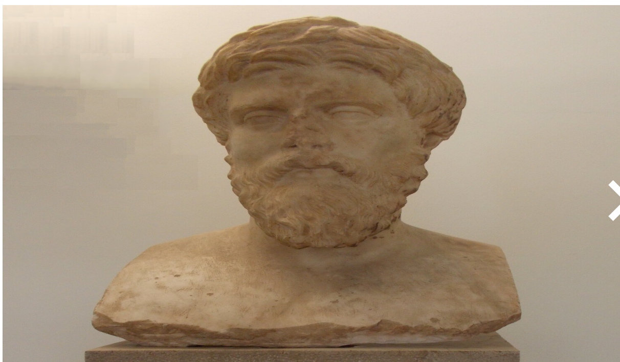
Autor nieznan, „Popiersie Plutarcha”, ok. 125 r. n.e., Muzeum Archeologiczne w Delfach