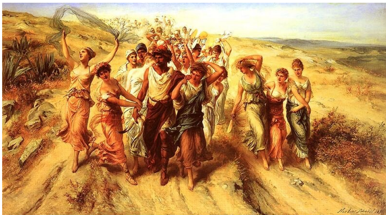
Poeta Anakreont z Muzami

Poniższy obraz niemieckiego malarza, Norberta Schrödl (przełom XIX i XX wieku), nosi tytuł Poeta Anakreont z muzami (1890). Nazwij relacje między Anakreontem a muzami.