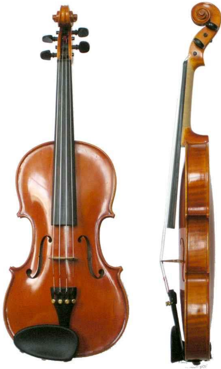
Rysunek 1. Skrzypce