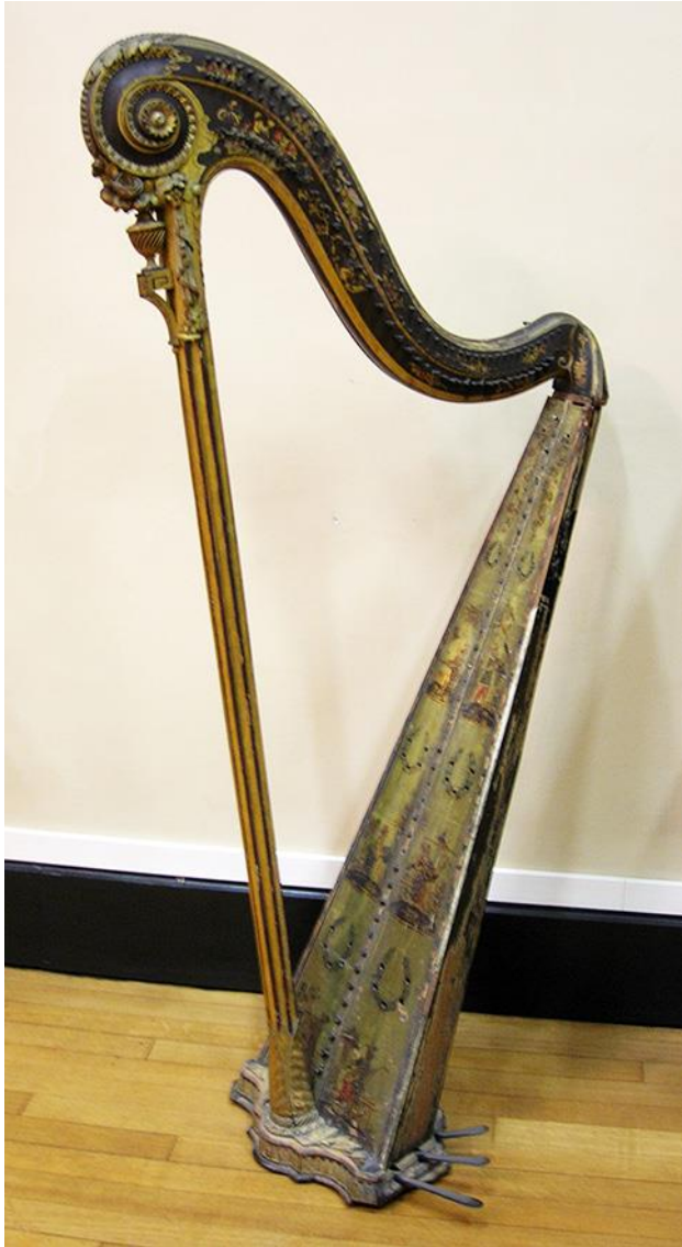
Rysunek 5. Harfa