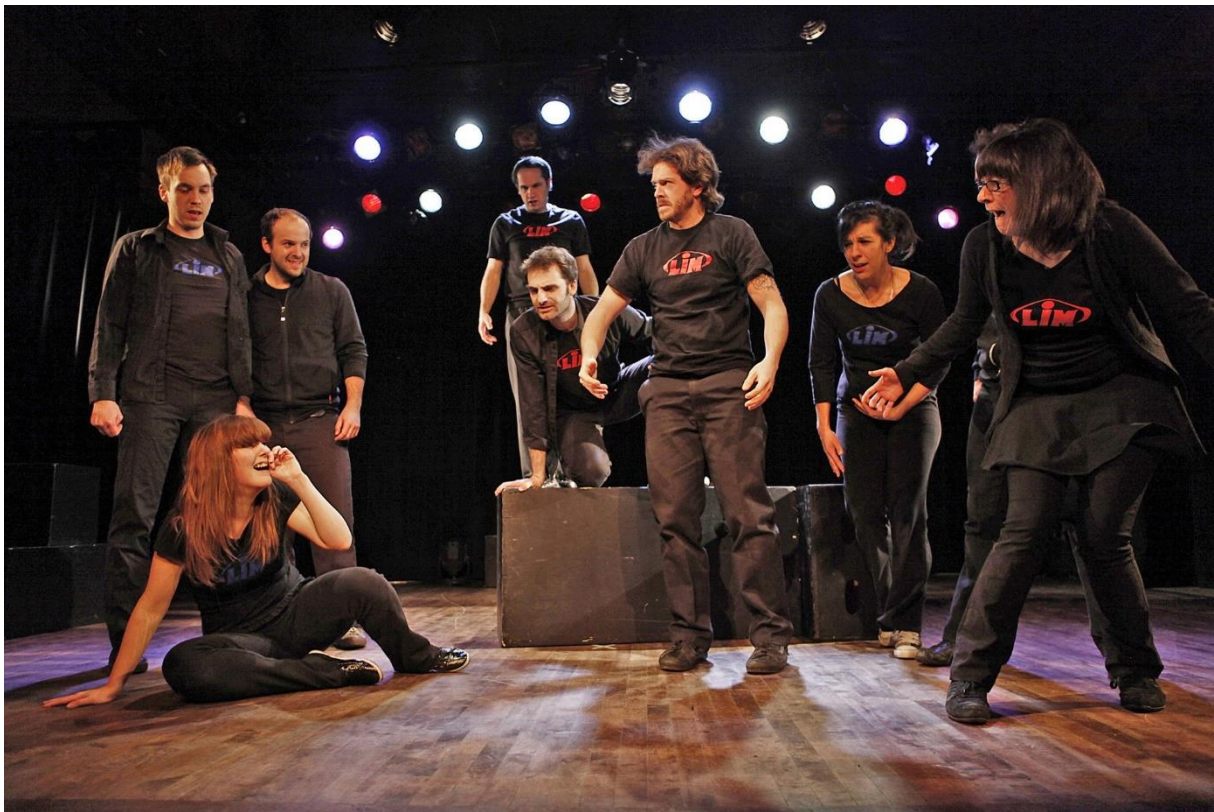
Rysunek 4. Improwizacje

Omawiając rodzaje improwizacji nauczyciel udostępnia ekran swojego komputera wspierając się zdjęciami.