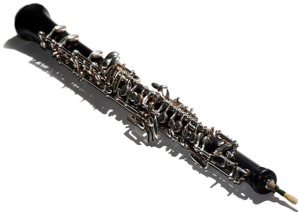
Rysunek 4. Obój, źródło: https://pl.wiktionary.org/wiki/ob%C3%B3j [dostęp: 29.09.2021].