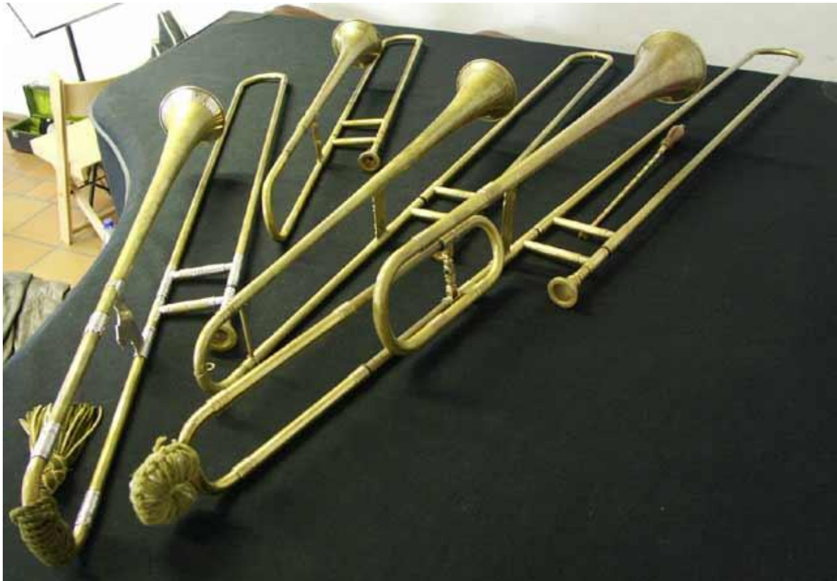
Rysunek 3. Puzon