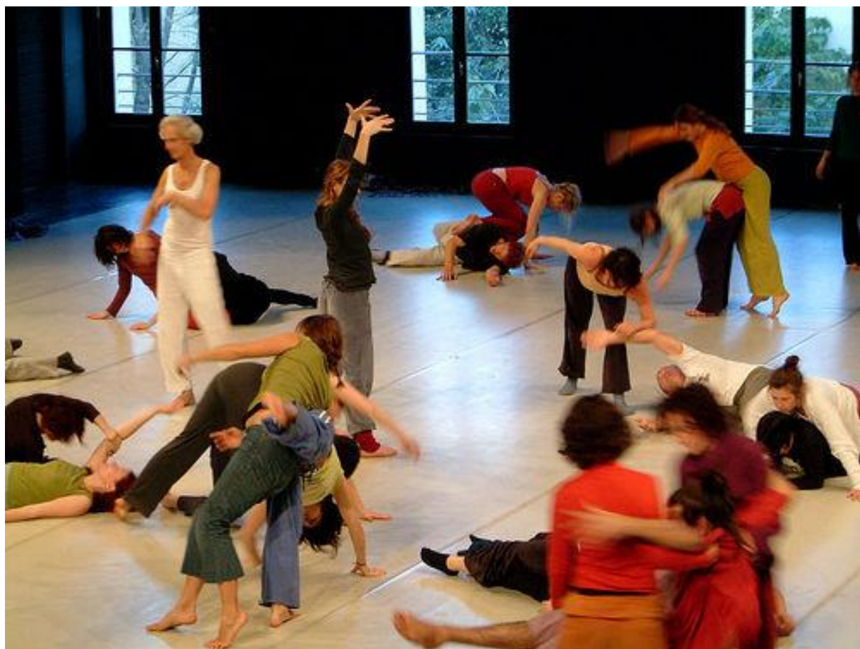
Rysunek 3. Improwizacje, źródło:

https://pl.wikipedia.org/wiki/Improwizacja_kontaktowa [dostęp: 29.09.2021].