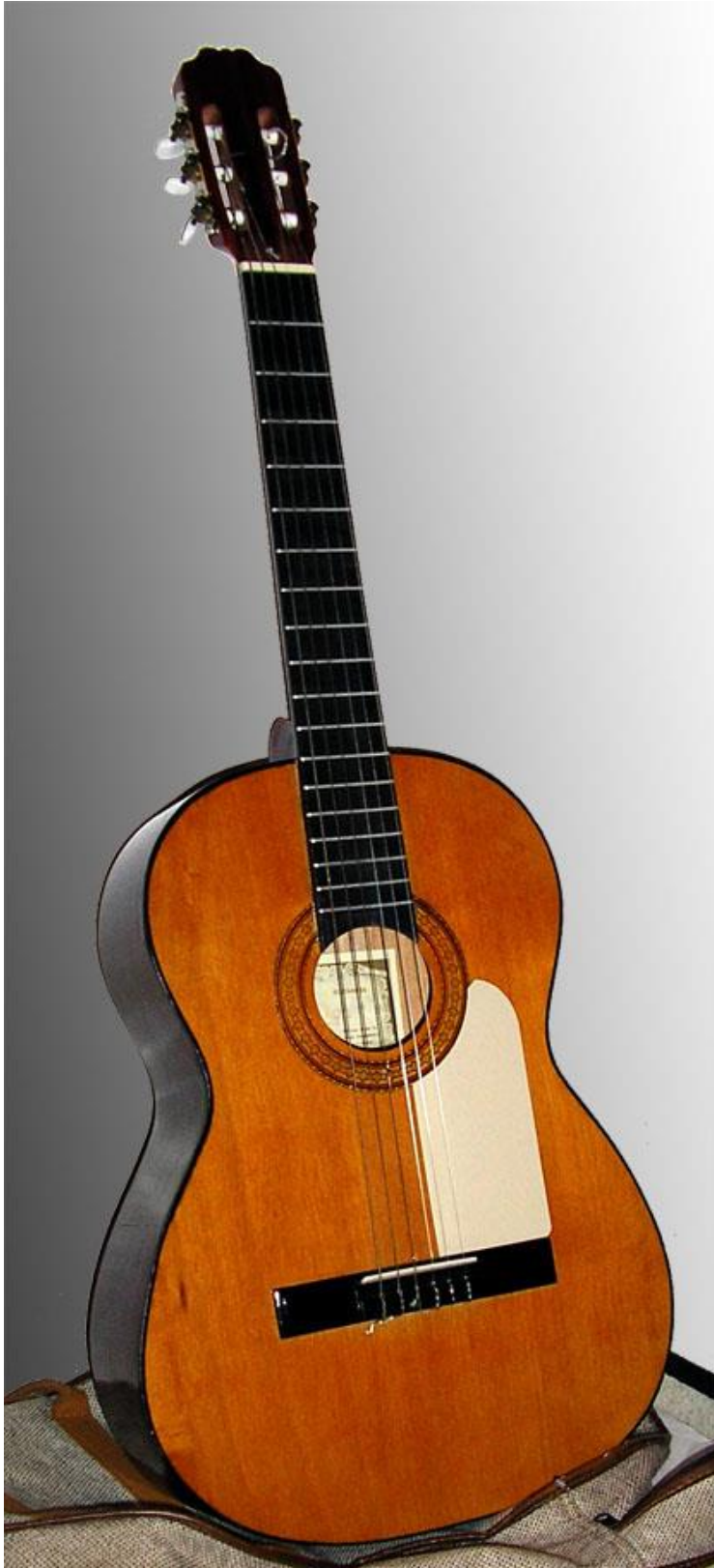
Rysunek 2. Gitara, źródło: https://pl.wikipedia.org/wiki/Gitara [dostęp: 29.09.2021].