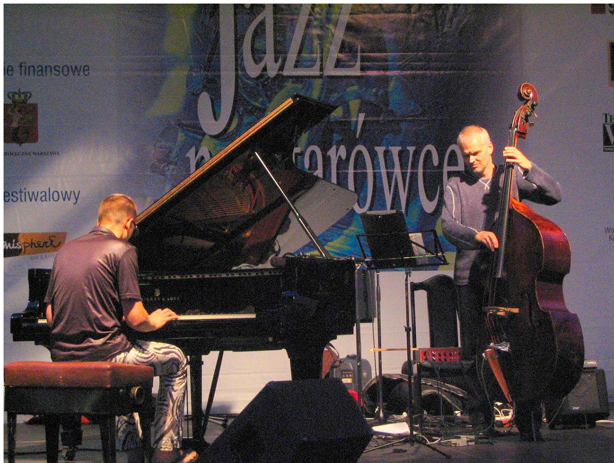
Rysunek 1. Improwizacje