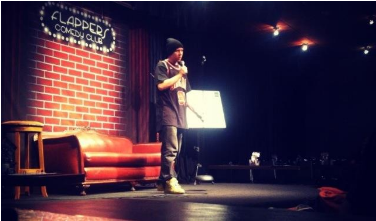
Rysunek 2. Improwizacje, źródło: https://pl.wikipedia.org/wiki/Stand-up_(komedia) [dostęp: 29.09.2021].