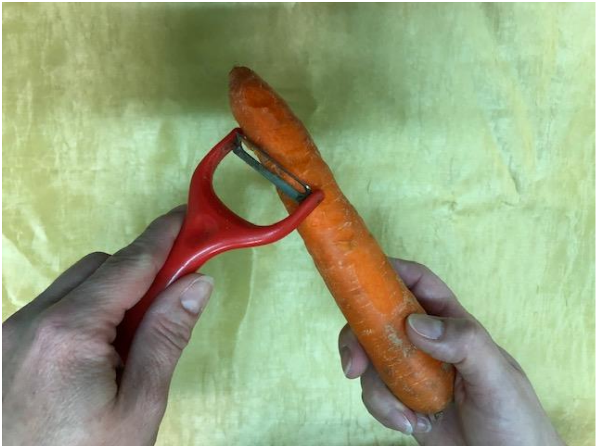
Zdjęcie 17 Surówka krok 2.

Format zdjęcia A4 – wydrukować i zaprezentować dzieciom fotografię