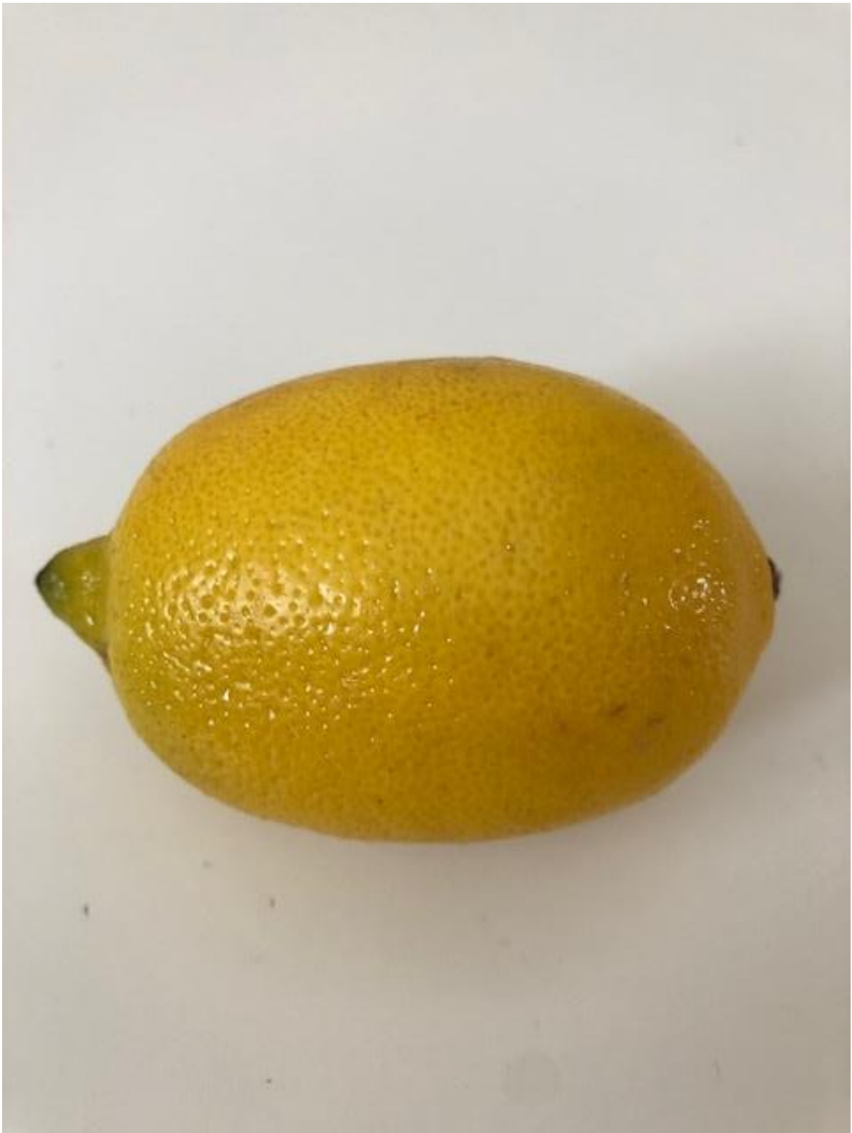
Zdjęcie 11 Cytryna.

Format zdjęcia A4 – wydrukować i zaprezentować dzieciom fotografię