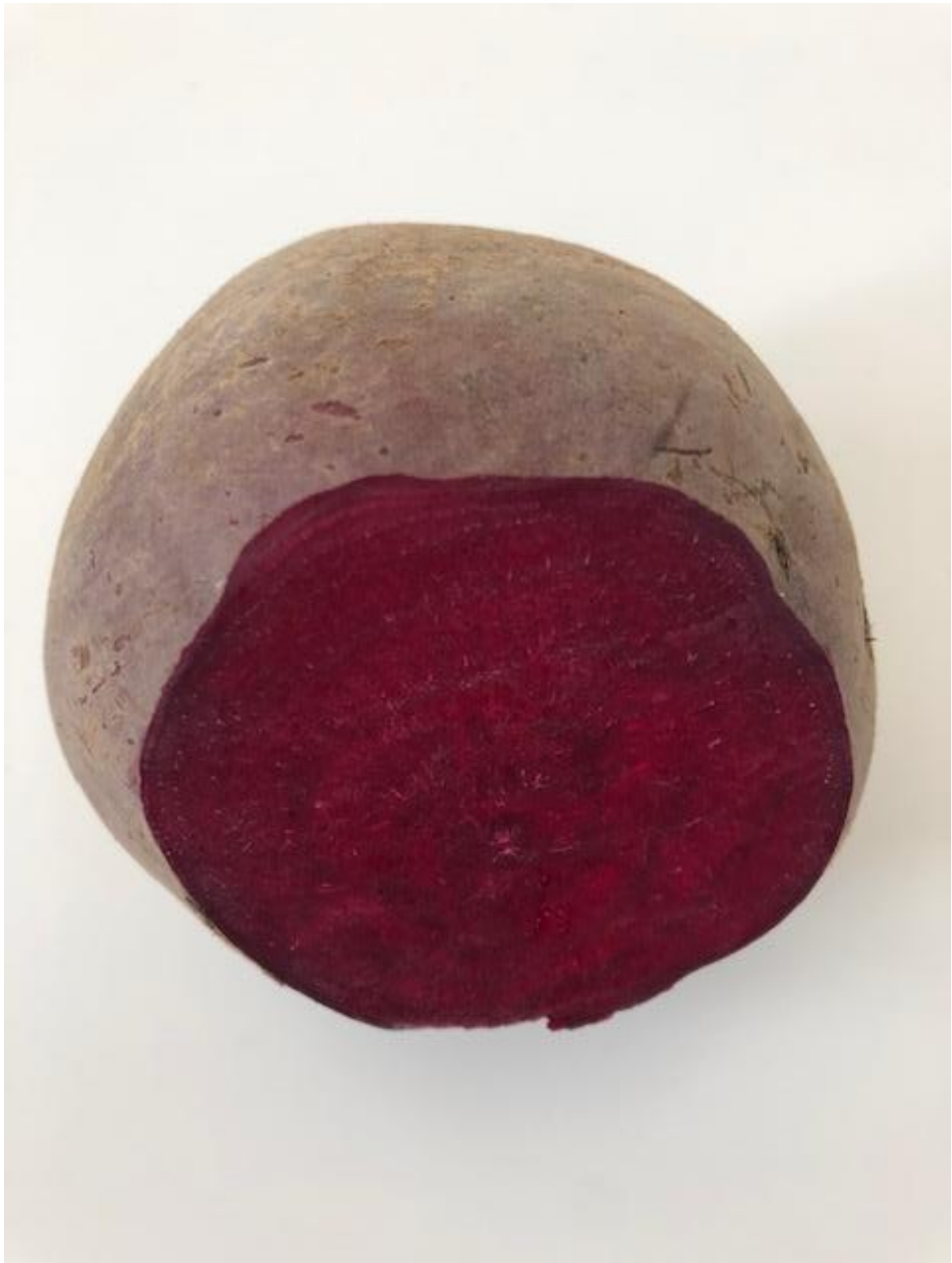
Zdjęcie 5 Burak.

Format zdjęcia A4 – wydrukować i zaprezentować dzieciom fotografię