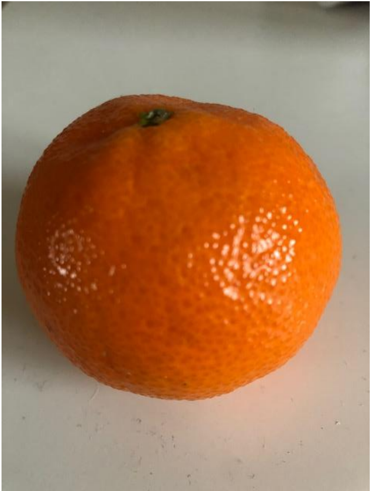
Zdjęcie 9 Mandarynka.

Format zdjęcia A4 – wydrukować i zaprezentować dzieciom fotografię