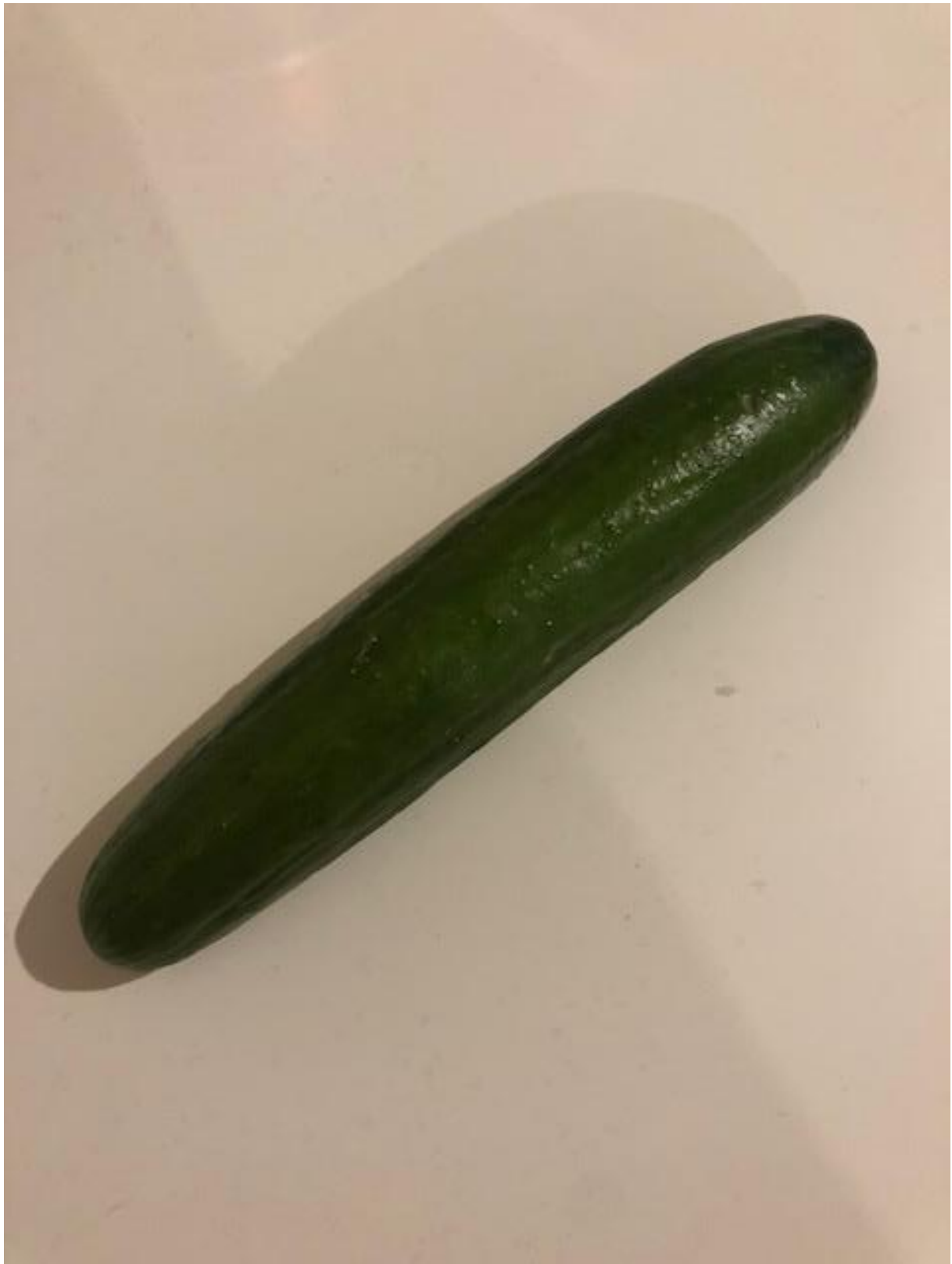
Zdjęcie 14 Ogórek.

Format zdjęcia A4 – wydrukować i zaprezentować dzieciom fotografię