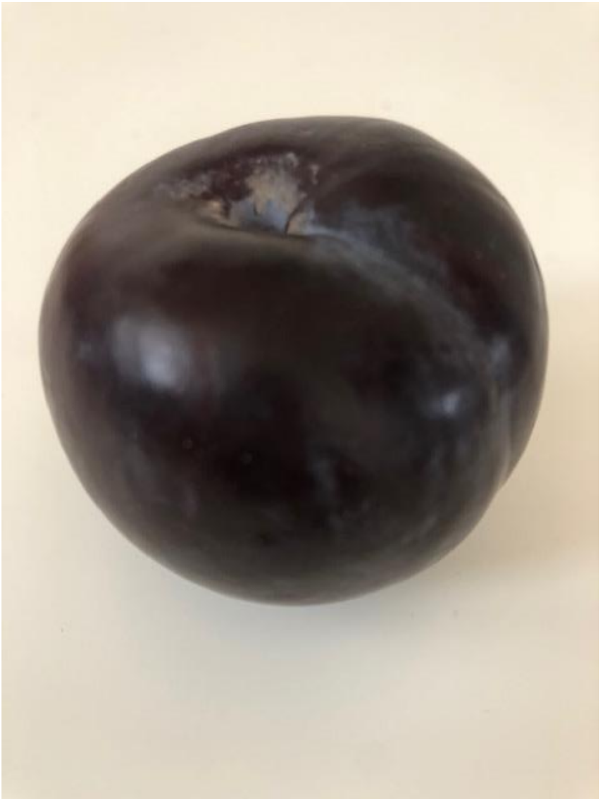
Zdjęcie 7 Śliwka.

Format zdjęcia A4 – wydrukować i zaprezentować dzieciom fotografię