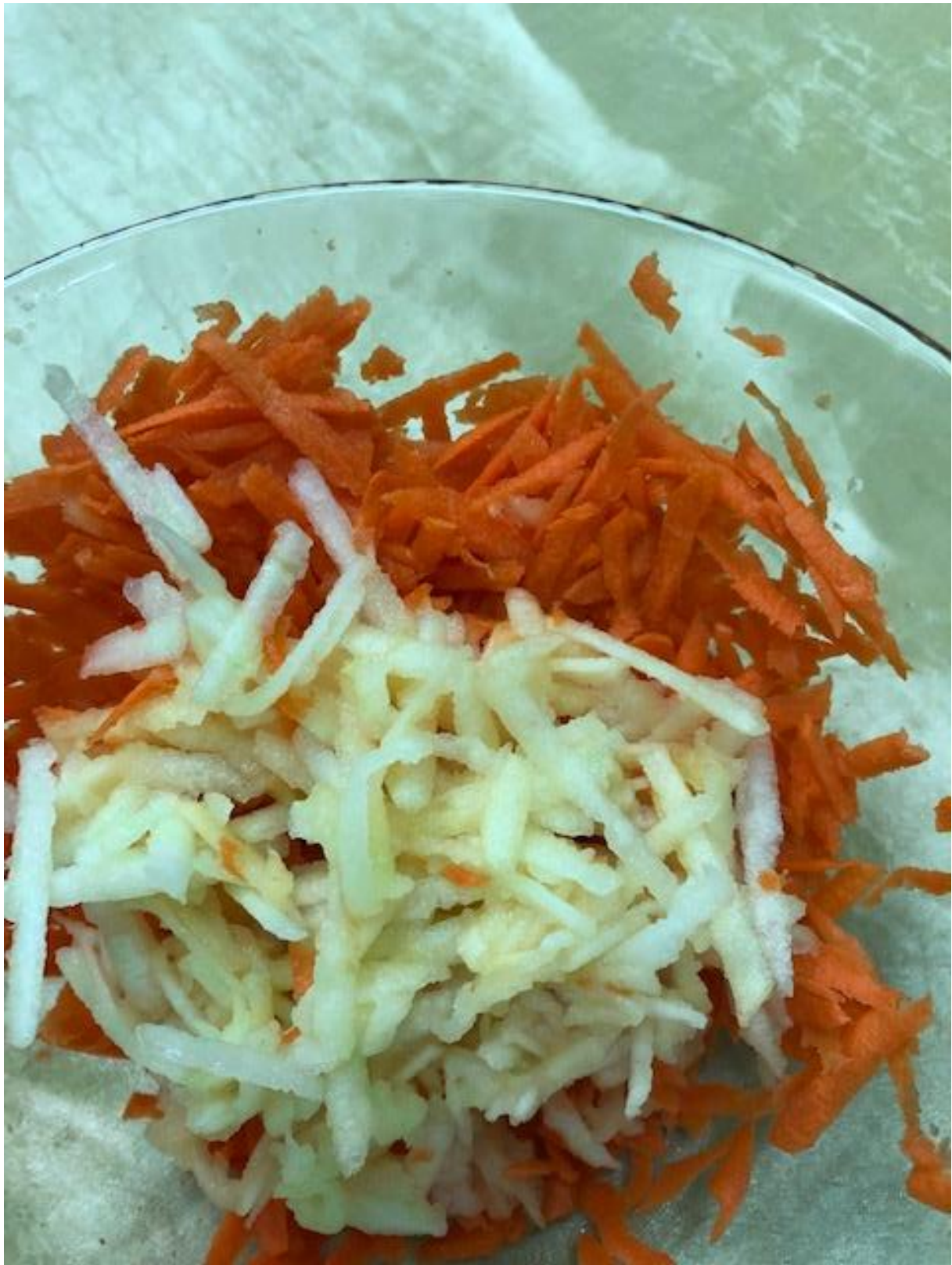
Zdjęcie 21 Surówka krok 6.

Format zdjęcia A4 – wydrukować i zaprezentować dzieciom fotografię