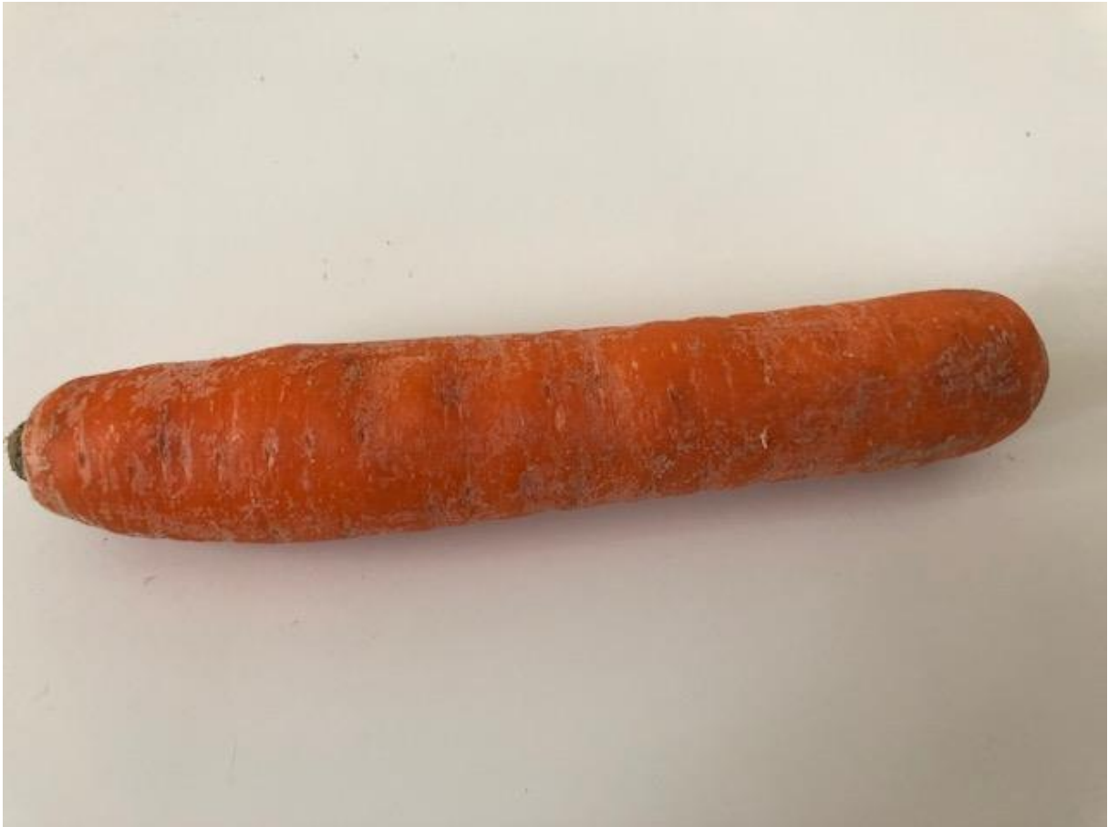
Zdjęcie 1 Marchewka.

Format zdjęcia A4 – wydrukować i zaprezentować dzieciom fotografię