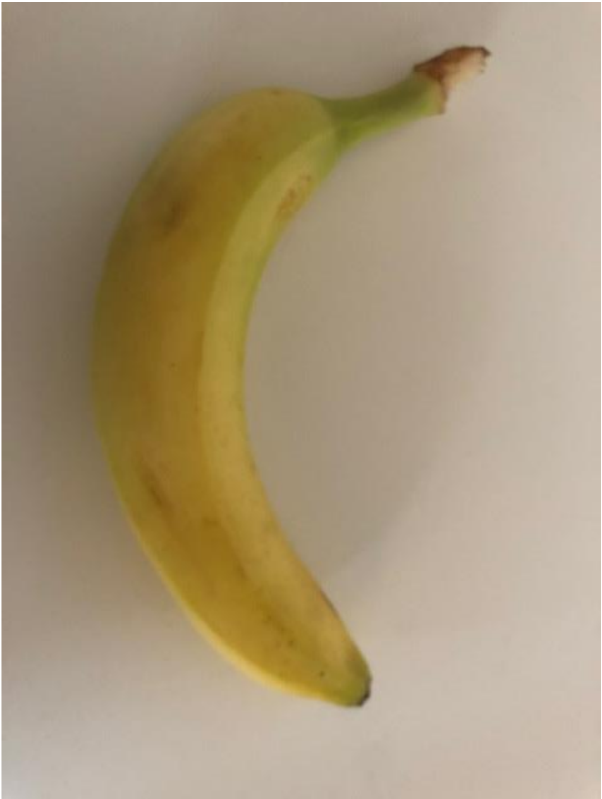
Zdjęcie 8 Banan.

Format zdjęcia A4 – wydrukować i zaprezentować dzieciom fotografię