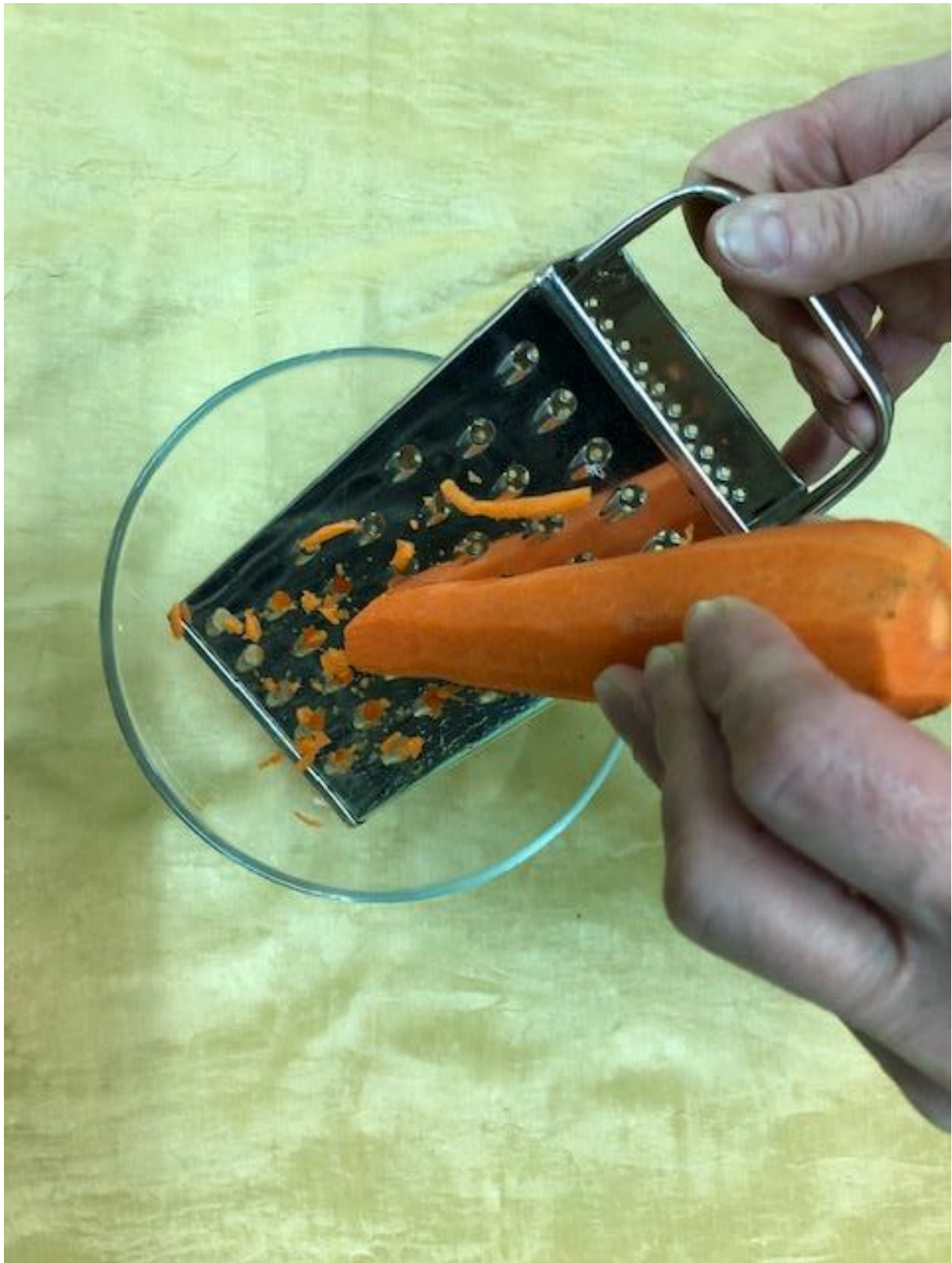
Zdjęcie 19 Surówka krok 4.

Format zdjęcia A4 – wydrukować i zaprezentować dzieciom fotografię