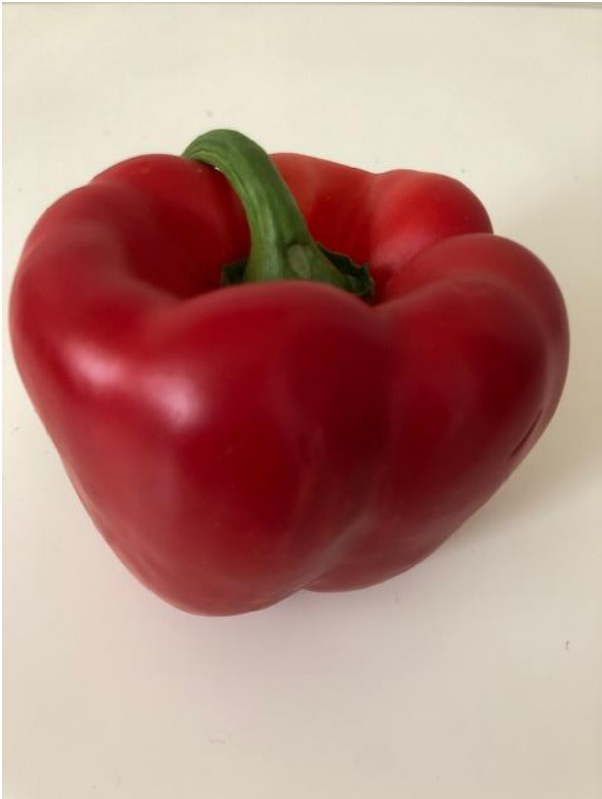
Zdjęcie 13 Papryka.

Format zdjęcia A4 – wydrukować i zaprezentować dzieciom fotografię