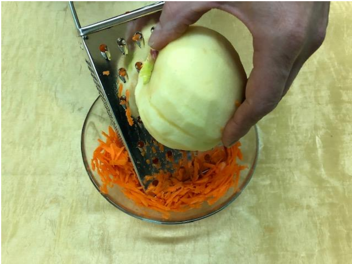
Zdjęcie 20 Surówka krok 5.

Format zdjęcia A4 – wydrukować i zaprezentować dzieciom fotografię