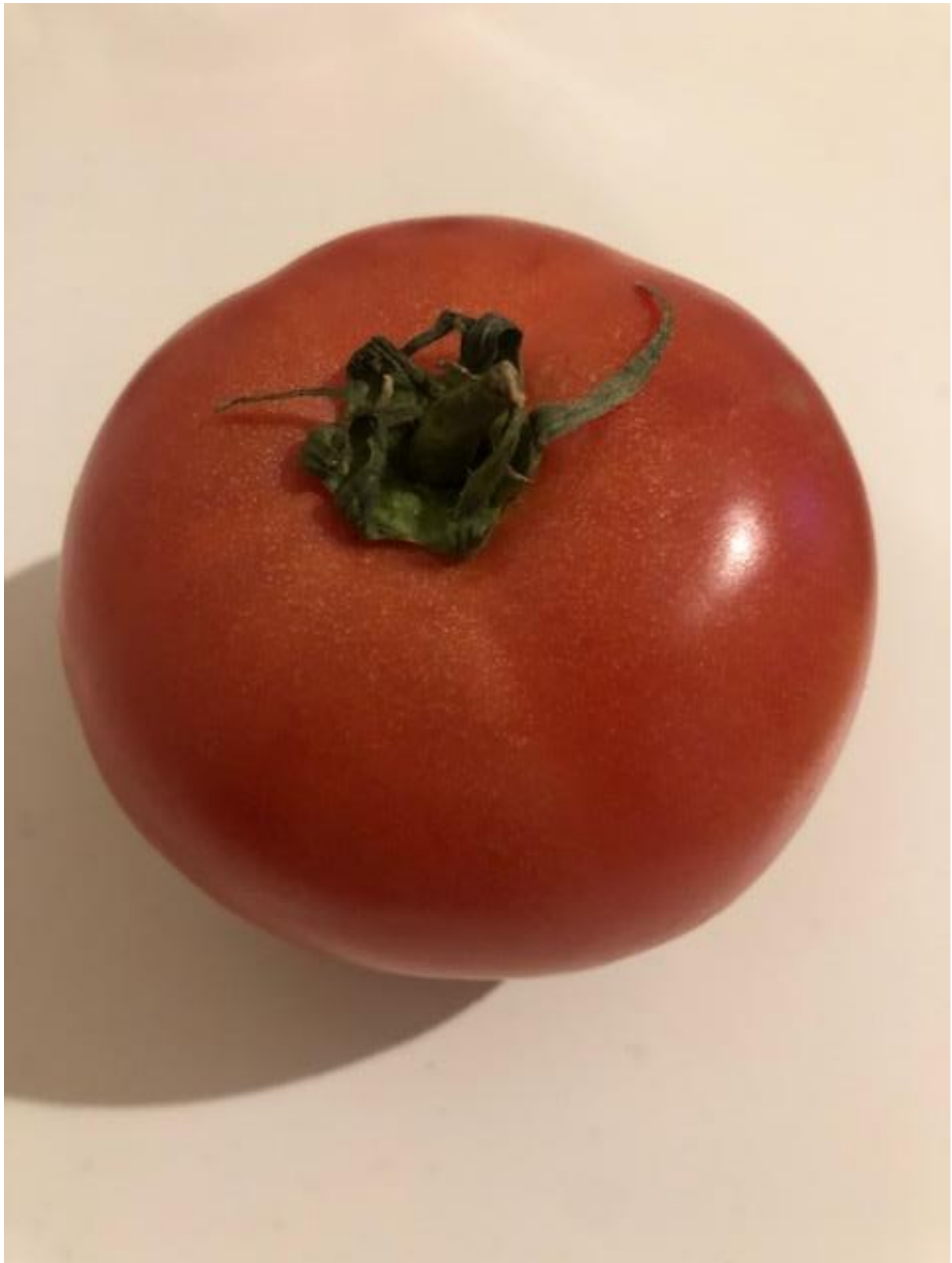
Zdjęcie 3 Pomidor.

Format zdjęcia A4 – wydrukować i zaprezentować dzieciom fotografię