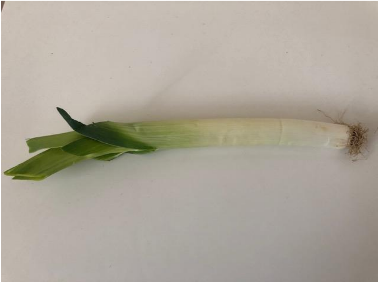
Zdjęcie 2 Por.

Format zdjęcia A4 – wydrukować i zaprezentować dzieciom fotografię