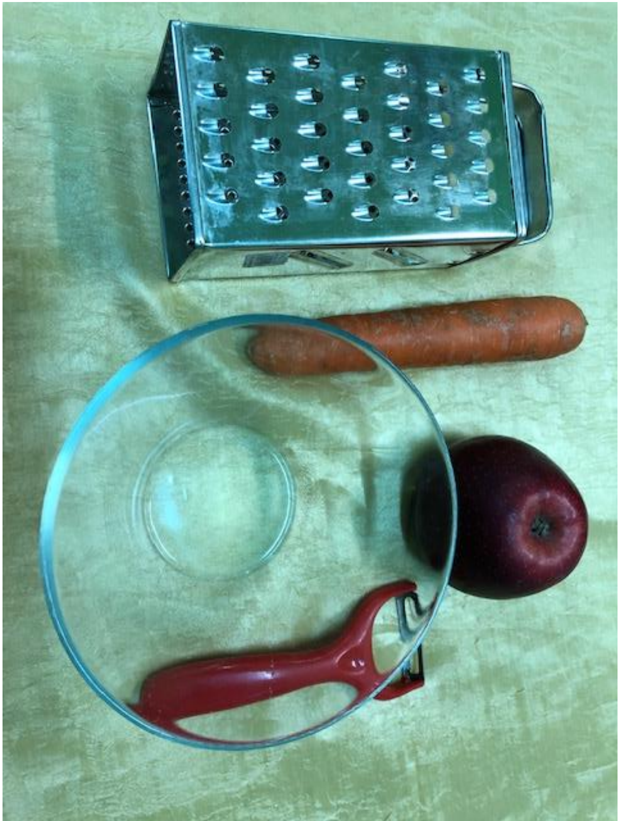
Zdjęcie 16 Surówka krok 1.

Format zdjęcia A4 – wydrukować i zaprezentować dzieciom fotografię