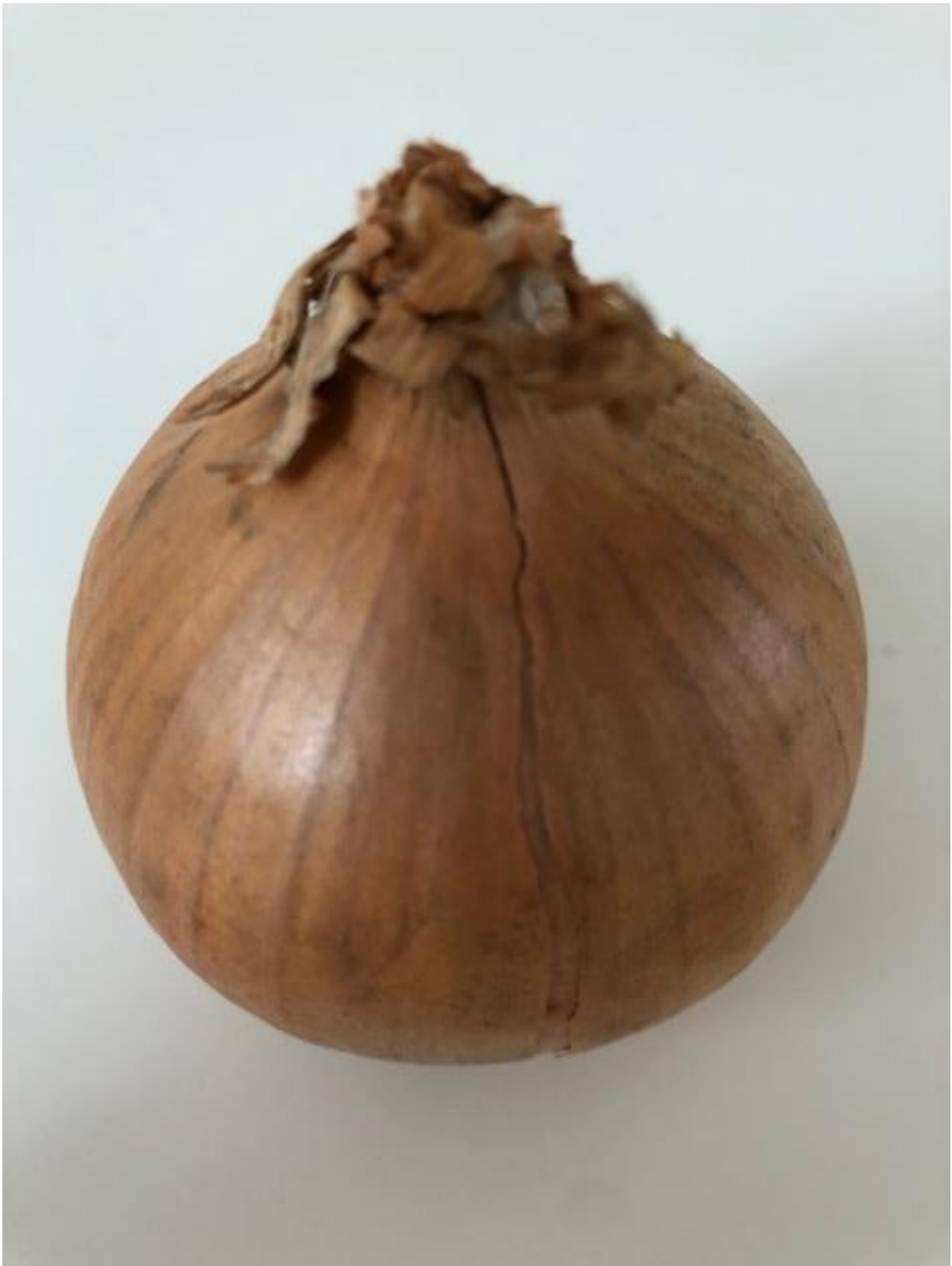
Zdjęcie 15 Cebula.

Format zdjęcia A4 – wydrukować i zaprezentować dzieciom fotografię