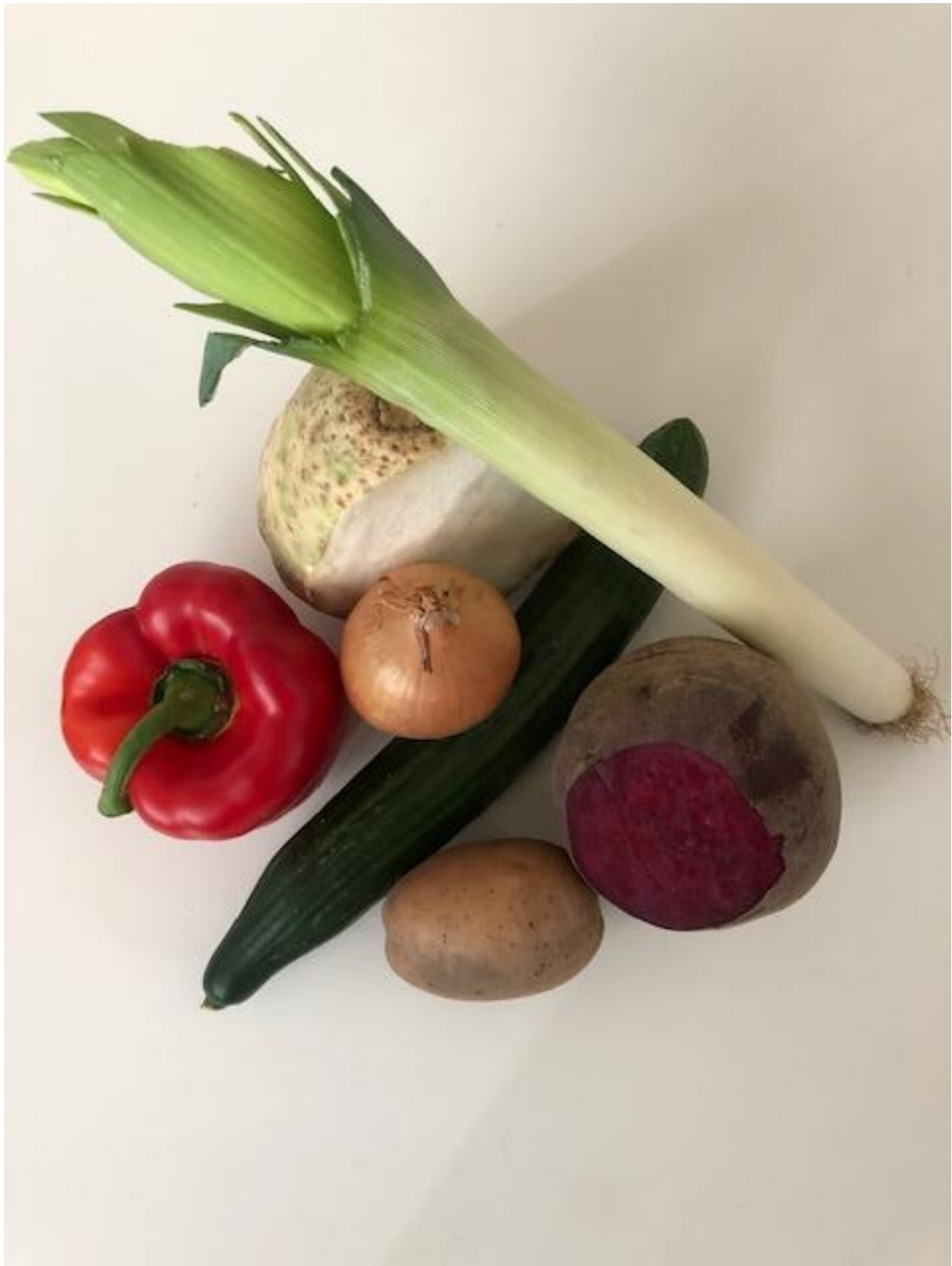
Zdjęcie 12 Kompozycja warzywa.

Format zdjęcia A4 – wydrukować i zaprezentować dzieciom fotografię