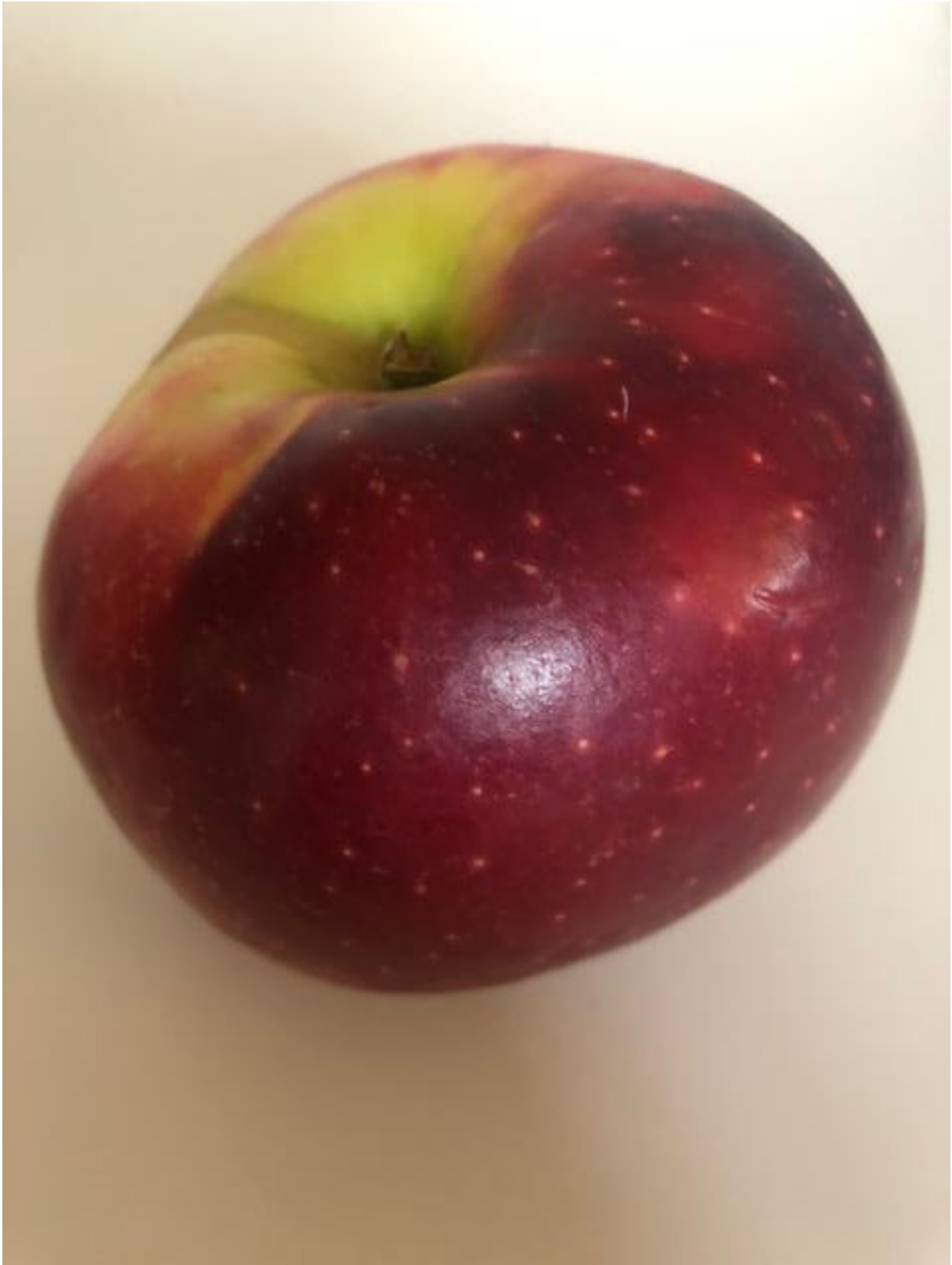
Zdjęcie 6 Jabłko.

Format zdjęcia A4 – wydrukować i zaprezentować dzieciom fotografię