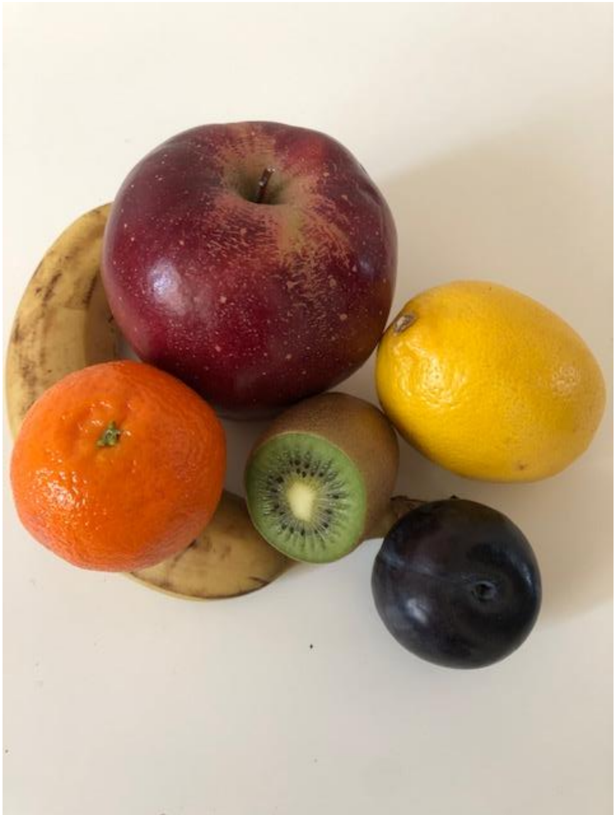
Zdjęcie 10 Kompozycja owoce.

Format zdjęcia A4 – wydrukować i zaprezentować dzieciom fotografię