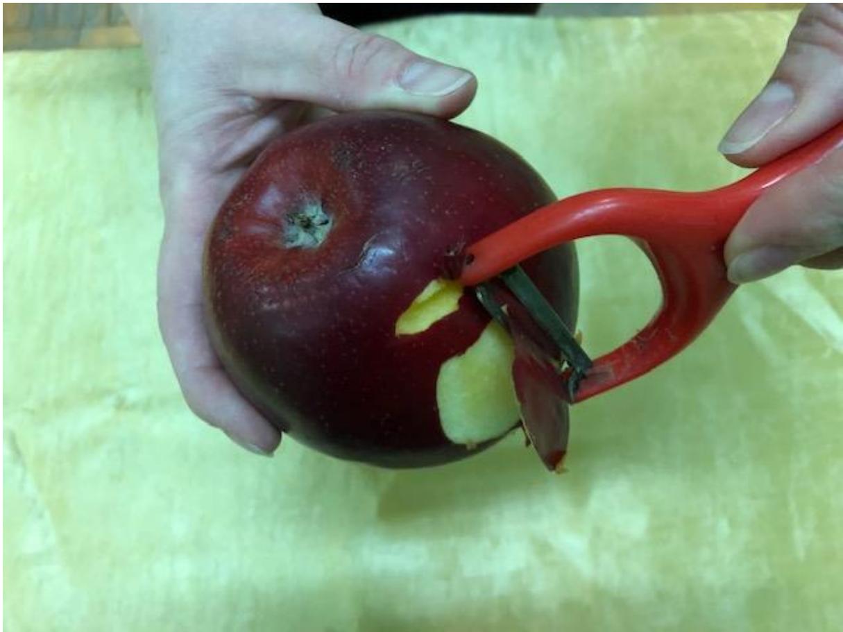
Zdjęcie 18 Surówka.

Format zdjęcia A4 – wydrukować i zaprezentować dzieciom fotografię