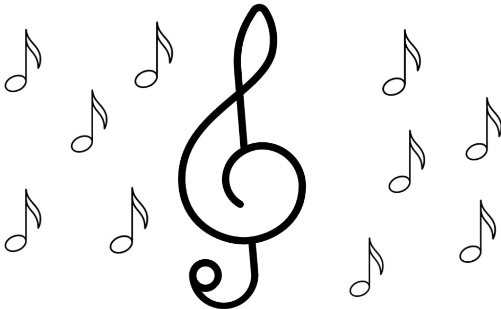
Zdjęcie 2 Muzyczny klucz wiolinowy z nutami.

Format rysunku A4 wydrukować (układ strony: poziomo) i przekazać dzieciom do pokolorowania ilustrację muzycznego klucza wiolinowego z nutami.