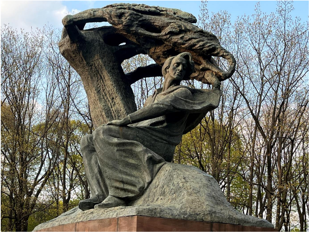
Zdjęcie 3 Zdjęcie pomnika Fryderyka Chopina w Łazienkach Królewskich w Warszawie.

Format A4, wydrukować i zaprezentować uczniom