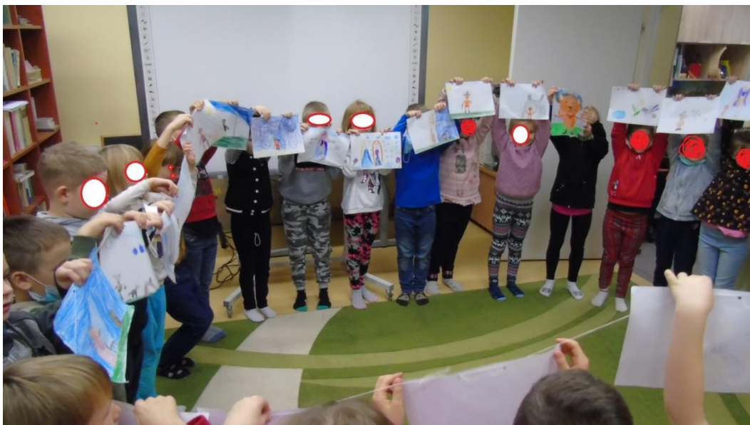
Fotografia 4. Lekcja biblioteczna.

Po prezentacji nauczyciel bibliotekarz wyraża podziw dla pięknych prac. Następnie prosi by każde dziecko kliknęło ikonkę emocji adekwatną do jego samopoczucia. Kończąc połączenie on-line dziękuje dzieciom i nauczycielowi za aktywność i żegna się.