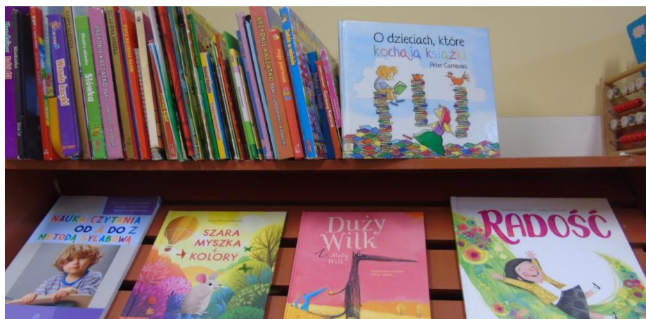
Fotografia1. Półka z książkami.

Informuje dzieci, że jest to film animowany co oznacza, że nie ma kwestii mówionych tylko obrazy i muzyka.