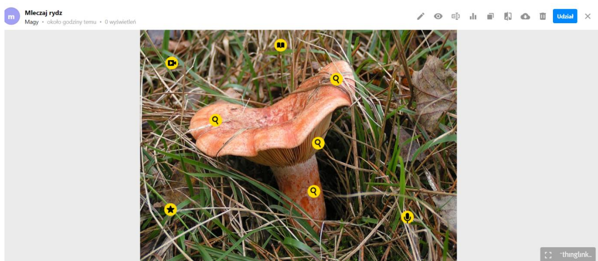
Ryc. 2. Przykład interaktywnego zdjęcia wykonanego w aplikacji Thinglink.