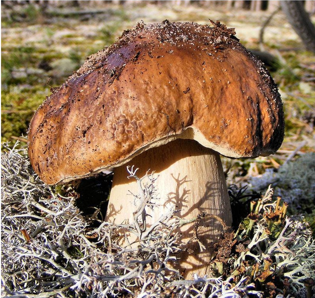
Ryc. 4. Borowik na tablicę Jamboard.