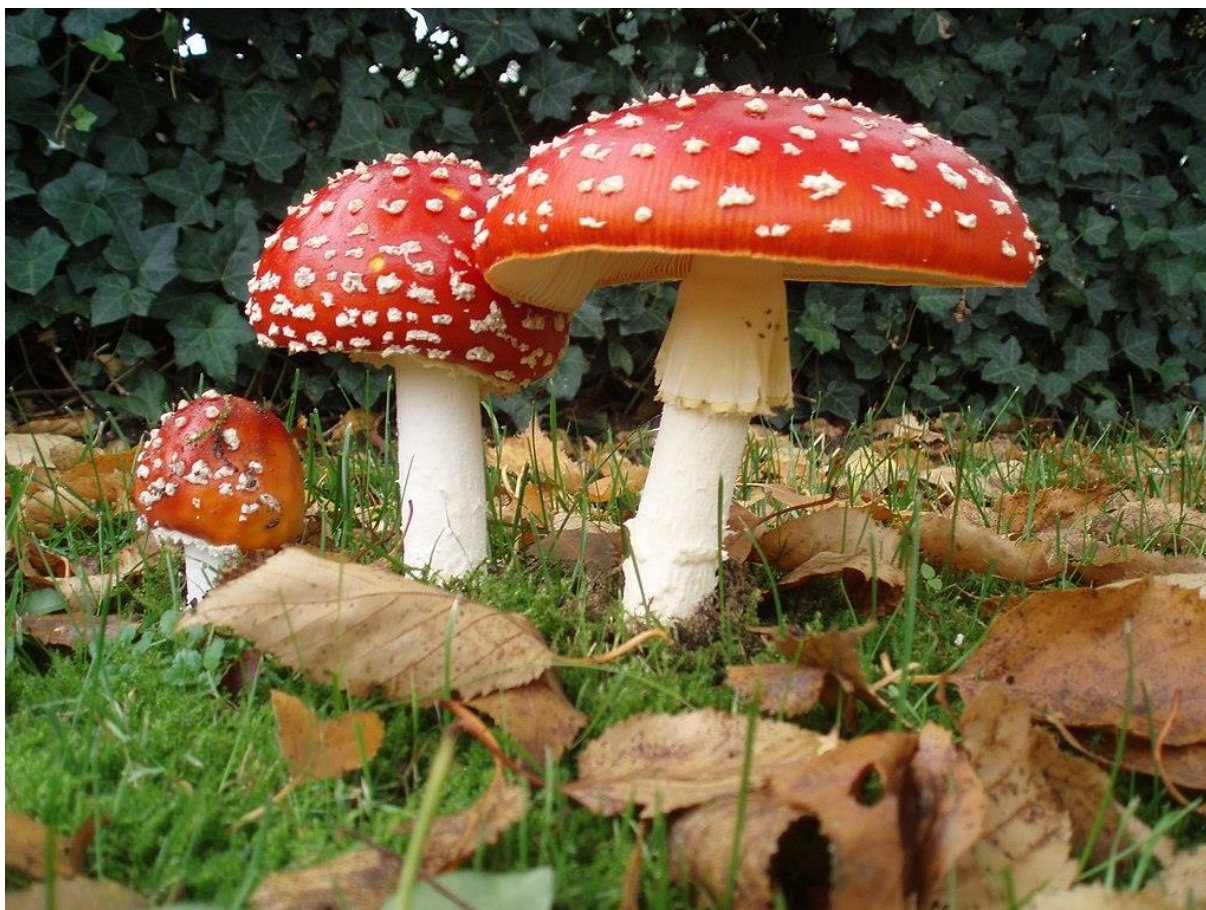
Ryc. 6. Muchomor na tablicę Jamboard. Opracowanie: Onderwijsgek na nl.wikipedia. CC BY-SA 3.0 nl