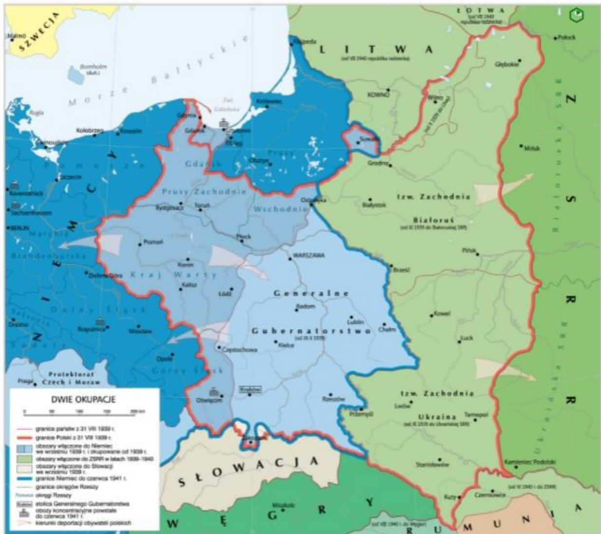
Polska pod okupacją niemiecką i sowiecką