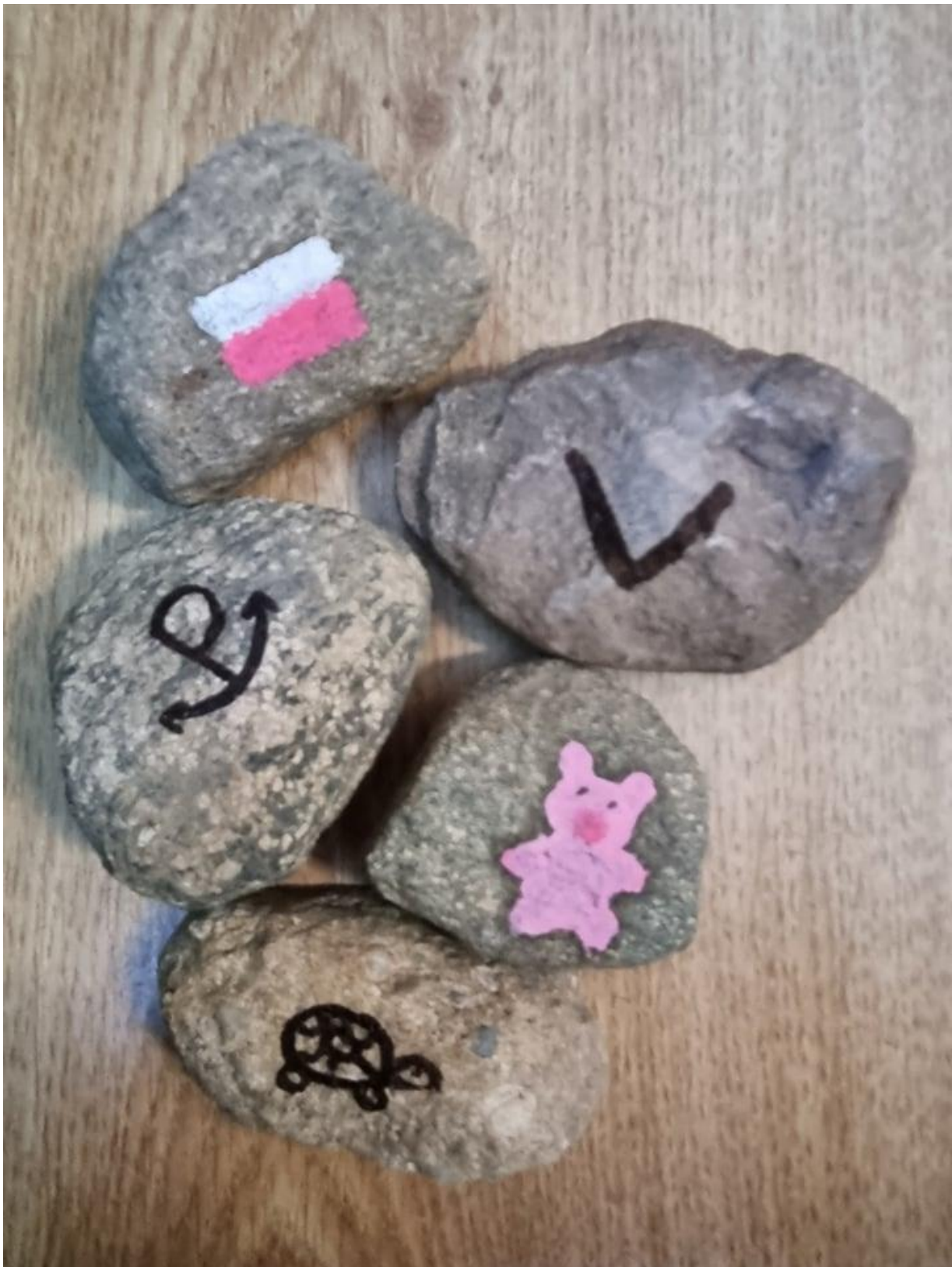
Rysunek 1. Przykładowe zdjęcie kamieni powstałych jako efekty pracy na lekcji