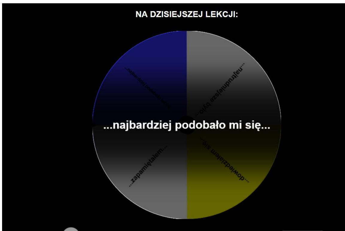
Rysunek 7. Ćwiczenie – koło ułatwiające podsumowanie lekcji przez ucznia (ewaluacja); źródło:

https://wheeldecide.com/index.php?c1=...dowiedzia%C5%82em+si%C4%99...&c2=...zapami%C4%99ta%C5%82em...&c3=...najbardziej+podoba%C5%82o+mi+si%C4%99...&c4=...najtrudniejsze+by%C5%82o...&t=Na+dzisiejszej+lekcji%3A&time=5