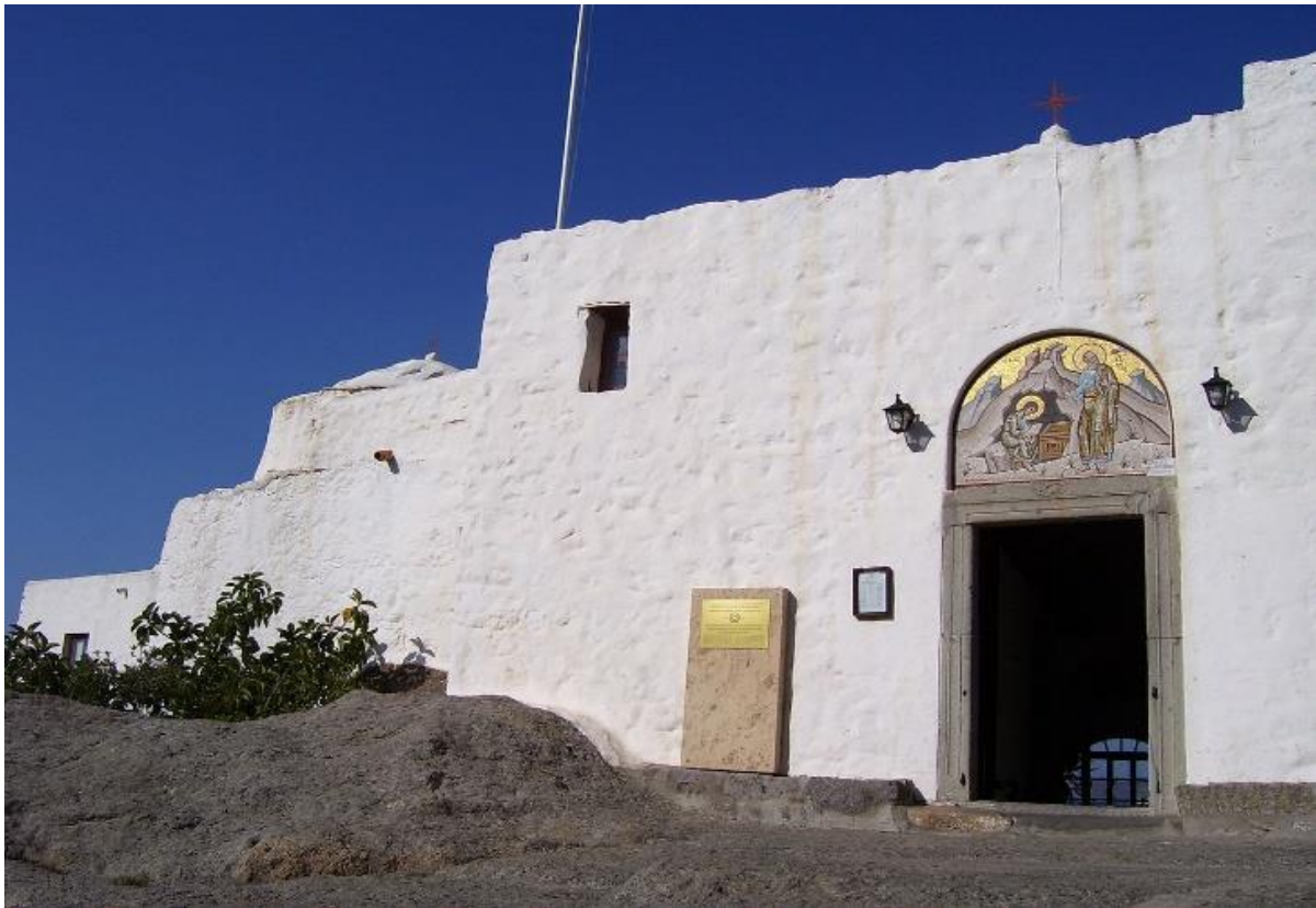
Grota Apokalipsy – jaskinia znajdująca się na greckiej wyspie Patmos